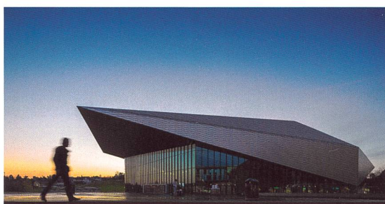
Figure 1: Le cadre futuriste de la journée d'étude d'IGS du 20 avril 2017 – Swiss Tech Convention Center à Lausanne

Avec les activités proposées dans le cadre de la célébration de son centenaire, l'IGS s'adresse à ses membres ainsi qu'à l'ensemble des spécialistes, jeunes ou chevronnés, liés de près ou de loin à la géoinformation et à la gestion du territoire. C'est ensemble qu'il nous faut relever les défis du futur, riches de multiples facettes, et trouver des solutions. Reconnaisable à ses formes spectaculaires, le Swiss Tech Convention Center à Lausanne est le lieu idéal pour la tenue de cette manifestation puisqu'il symbolise avec audace un vaisseau prêt à décoller vers l'avenir. Embarquons donc ensemble!