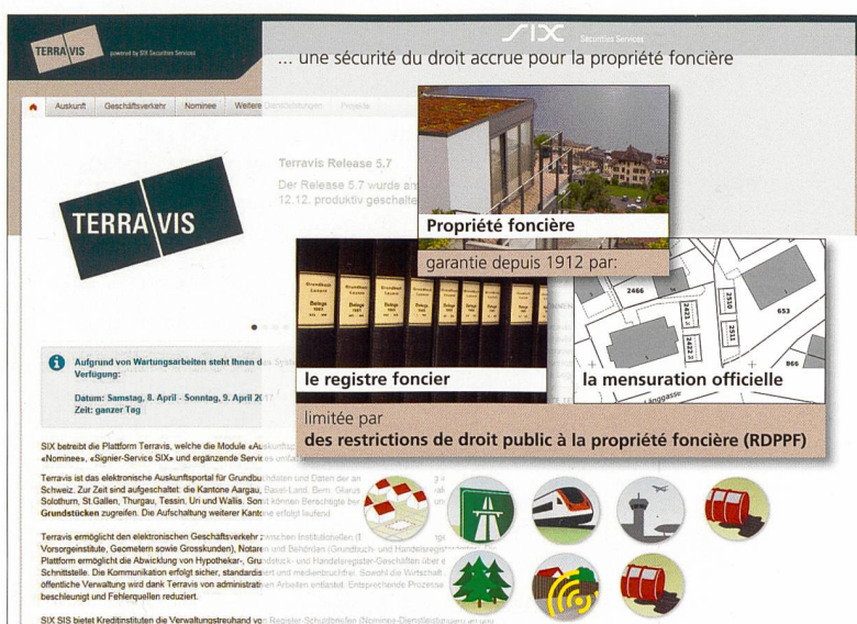
Figure 1: Réunion de toutes les données concernées sur le portail de renseignements

Contrairement aux dispositions de droit privé qui sont inscrites au registre foncier dans le canton de Nidwald et qui sont d'ores et déjà largement accessibles (seules deux communes font encore défaut), celles de droit public n'étaient pas centralisées dans un registre jusqu'à présent. Grâce au projet pilote d'«introduction du cadastre des restrictions de droit public à la propriété foncière (cadastre RDPPF)», le canton de Nidwald a pu faire entrer ce cadastre dans sa phase d'exploitation le 24 janvier 2014 et mettre à disposition les géodonnées du cadastre RDPPF de la première phase sur le portail de la société GIS Daten AG.