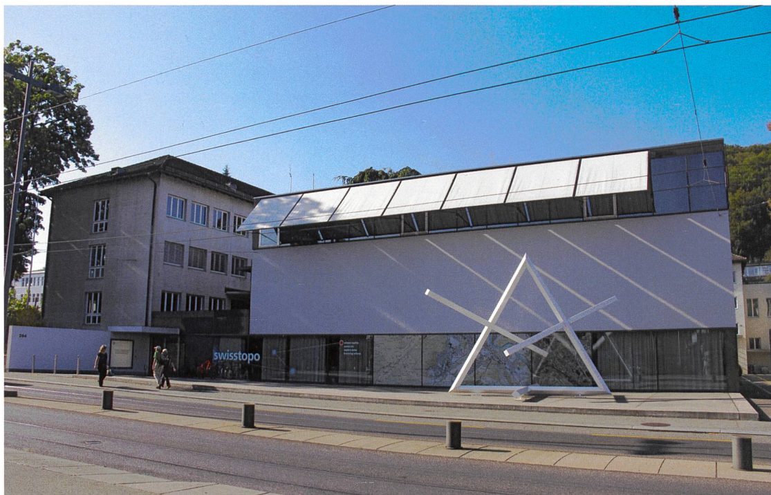
Figure: L'Office fédéral de topographie swisstopo, Seftigenstrasse 264, 3084 Wabern

C'est chose faite depuis un bon mois: après avoir passé un peu moins de trois ans dans les locaux de l'Institut fédéral de métrologie METAS, Lindenweg 50 à Wabern, le personnel de l'ancienne Direction fédérale des mensurations cadastrales a réintégré les bâtiments de l'Office fédéral de topographie swisstopo, sis à la Seftigenstrasse 264.