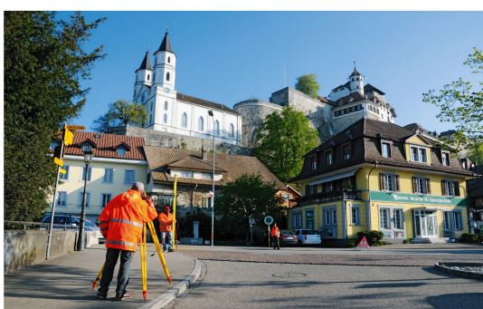
Figure 1: campagne de mesures au pied du château d'Aarburg (AG)

Au début de cette année, le domaine «Géodésie et Direction fédérale des mensurations cadastrales» a établi le programme des nouvelles mesures à effectuer au cours des cinq prochaines années (entre 2021 et 2025) pour le réseau altimétrique national. La genèse de ce programme et les tronçons le long desquels des nivellements de précision seront réalisés dans les années à venir sont détaillés dans cet article.