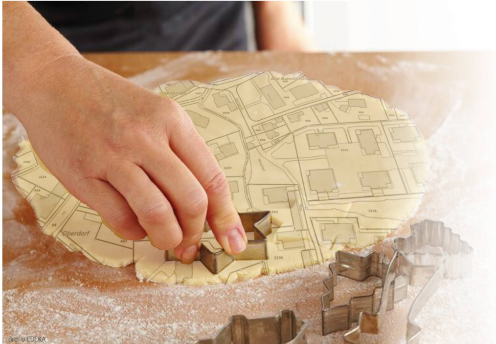
Figure 1: la découpe à l'emporte-pièce à travers les couches d'information

Aujourd'hui, les cantons disposent presque tous d'un accès par voie électronique aux données du registre foncier ouvertes au public. Dans ceux où cet accès fait encore défaut, des travaux correspondants sont en cours ou vont démarrer prochainement. On remarquera ici que les cantons ont développé chacun leurs propres solutions.