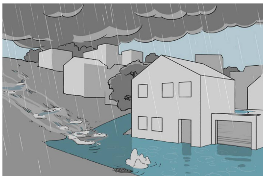
Figure 1: Des pluies intenses localisées déversent en quelques minutes des quantités d'eau qui dépassent les capacités des installations d'évacuation. Deux bâtiments sur trois en Suisse sont potentiellement menacés par le ruissellement de surface.

Rappelons qu'il est tout à fait possible de mener de pair densification intérieure et adaptation au changement climatique, au prix toutefois d'une qualité de planification très exigeante. La gestion des fortes pluies requiert ainsi de tout mettre en œuvre pour maintenir les couloirs de ruissellement bien dégagés afin que l'eau qui s'écoule lors d'une averse orageuse puisse être acheminée sans dommages entre les bâtiments et les éléments