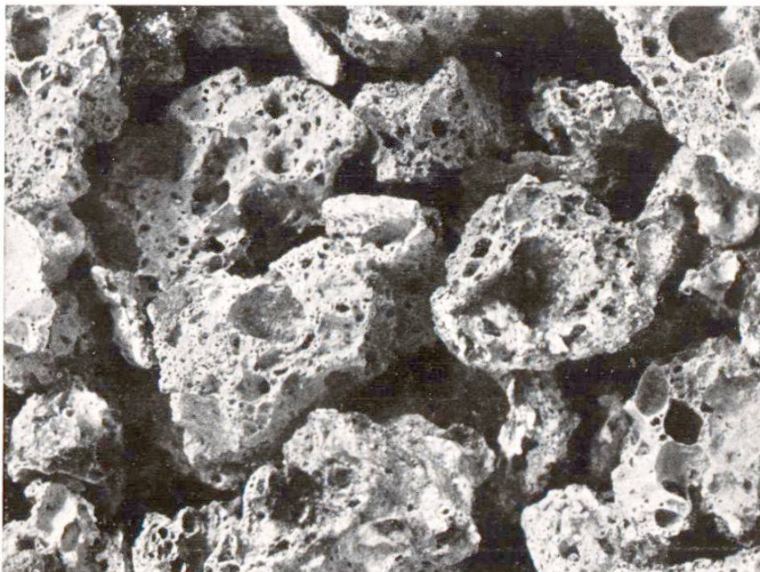
Abb. 1 Thermositkörnungen zweimal vergrößert