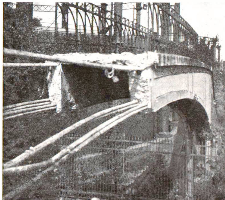
Abb. 2 Eisenbetonsteg aus dem Jahre 1902.

Von Prof. J. A. Bakker wurde auch, vor dem Abbruch eines Eisenbetonsteges aus dem Jahre 1902, eine umfangreiche Belastungsprobe vorgenommen. Das aus einem eingespannten Gewölbe von 29 m Spannweite und zwei Zugangstreppe bestehenden Bauwerk konnte nach 30 Jahren, und trotz einiger Ausführungsfehler, noch eine Totallast von 114 000 kg, d. h. 3900 kg pro laufenden Meter tragen.