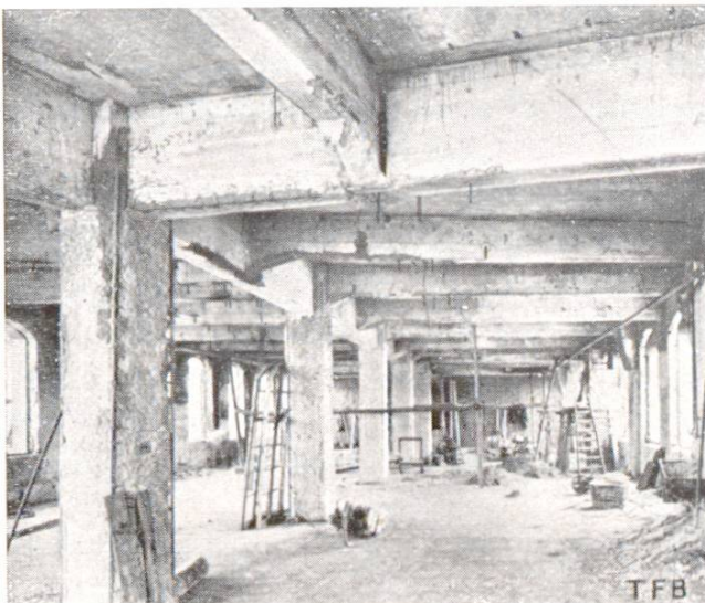
Abb. 2 Eisenbetondecke nach der Explosion und dem Brand einer Bleistiftfabrik in Nürnberg

Während des Weltkrieges hatte man hinreichend Gelegenheit, die Schuss- und Bombenwirkung an Eisenbetonbauten, sowie an Festungsbauten, die aus Eisenbeton bestehen, zu beobachten.