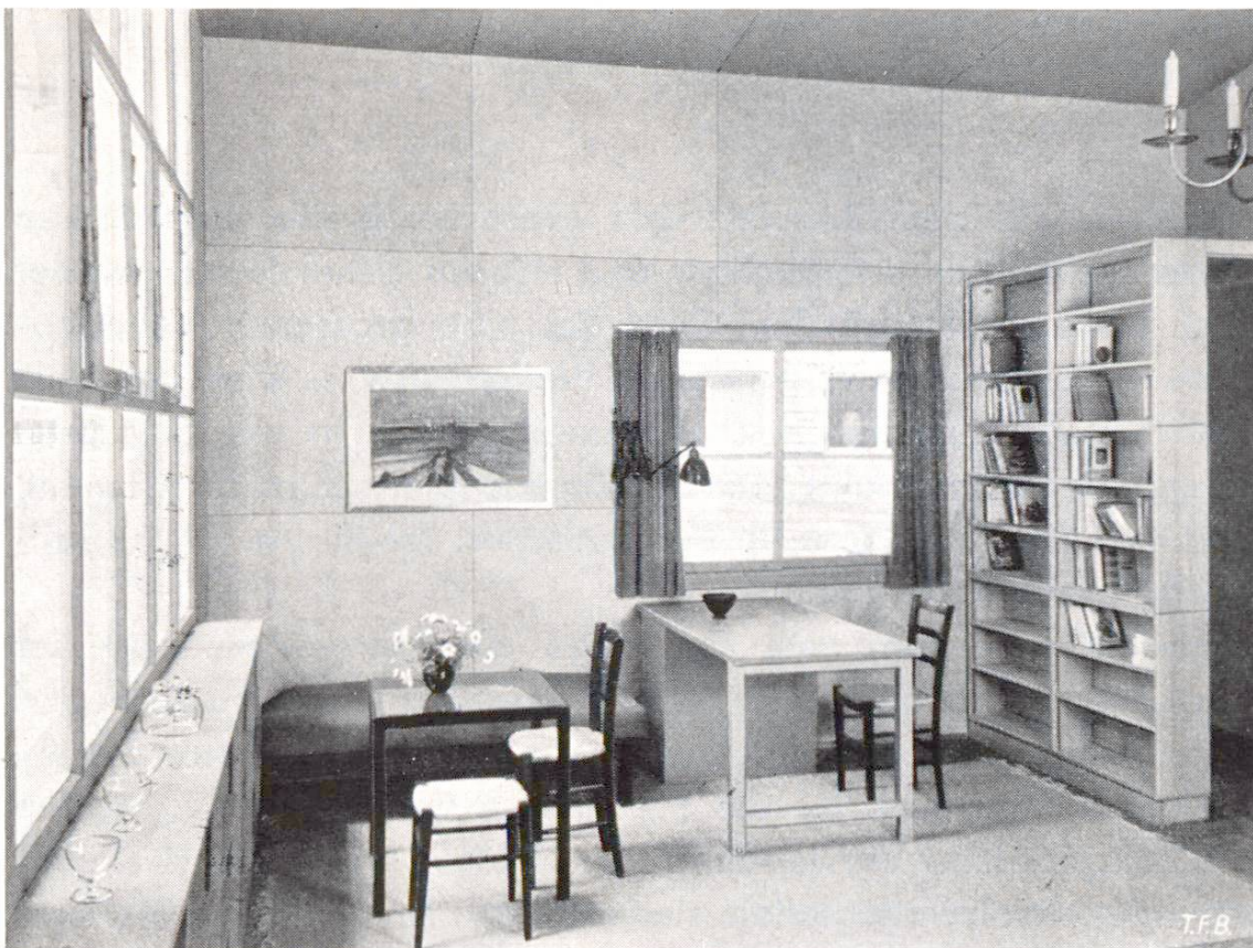
Abb. 3 Verkleidung und Möbel aus Schweizerholz

Modernes Eisenbetonhaus mit weitgehender Verwendung von Holz im Innenausbau.