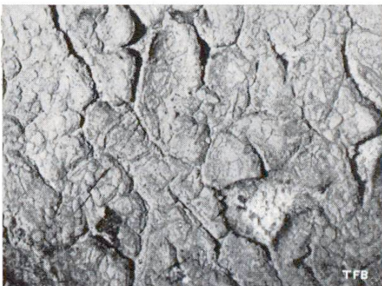
Abb. 1 Zersetzung eines Oelfarbanstriches auf alkalischer Betonunterlage. - Geeignete Vorbehandlung des Betons wurde unterlassen.

5. Oelanstrich : — organische Oele und Farbstoffe — Ein Oelanstrich ist nur auf genügend abgebundenen Mörteln und Betons haltbar, weil das beim Abbinden freiwerdende Kalkhydrat und die im Cement enthaltenen Alkalisalze die Oelfarbe verseifen (chemische Zersetzung des Anstriches und der darunter liegenden Mörtelschicht, Aufblähung des Farbfilmes, Fleckenbildung) — siehe Abb. 1 und 2. — Aus diesem Grunde sollte man mit dem Auftragen des Anstriches mindestens ein Jahr warten, d. h. bis der freie Kalk karbonatisiert ist und die Alkalien durch den Regen ausgewaschen worden sind. Muss der Anstrich früher aufgebracht werden, so ist eine besondere Behandlung der Unterlage unerlässlich, wie z. B. das Anstreichen mit Magnesiumfluat. Die in der