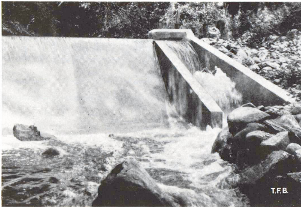
Abb. 1 Hydraulische Bindemittel müssen ständiger mechanischer und lösender Einwirkung von Wasser grösstmöglichen Widerstand leisten.

Während die Cemente und der hydraulische Kalk auch an der Luft einwandfrei erhärten, sofern ihnen die zum Erhärten notwendige Feuchtigkeit nicht vorzeitig entzogen wird, und daher auch zu allen Luftbauten geeignet sind, besteht bei den Mischbindemitteln aus Puzzolanen diese Eignung zu Luftbauten nicht uneingeschränkt, da sie gern zu Schwindrissigkeit (Netzrisse an der Oberfläche) neigen. Da ihnen damit die universelle Anwendbarkeit der übrigen Bindemittel abgeht, sind sie im Gegensatz zu früheren Zeiten nur noch von geschichtlicher Bedeutung.