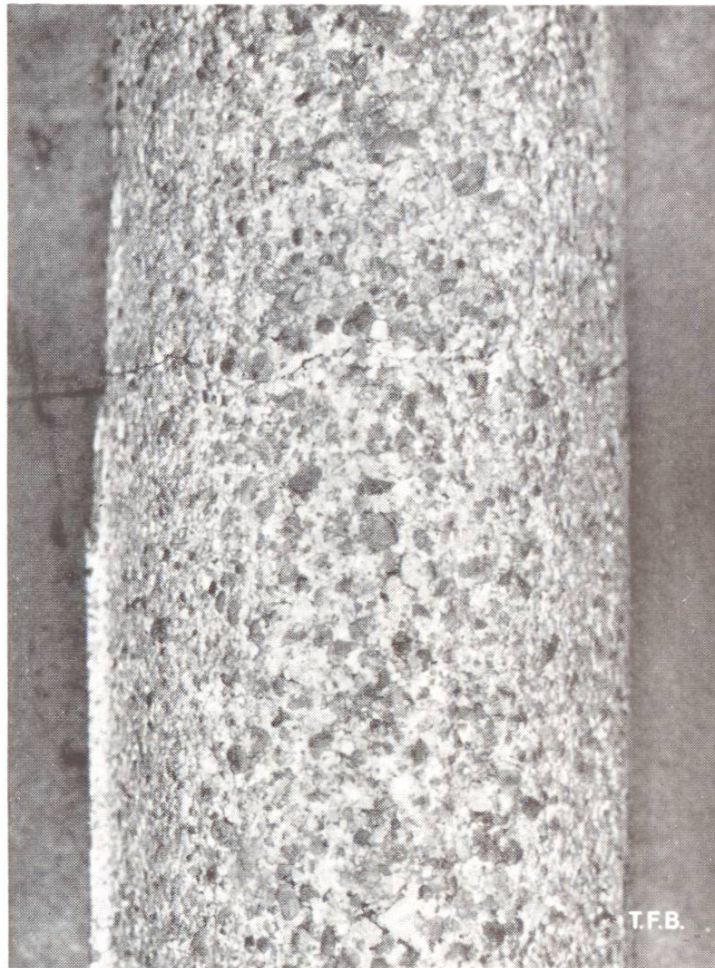
4 Abb. 3 Vergrößerte Wiedergabe von Betonoberfläche, die während ca. 40 Jahren destilliertem Wasser ausgesetzt war

eine prompte Erhärtung . Sie machen den Hauptbestandteil derjenigen Bindemittel aus, welche den Namen Cement mit Recht tragen und in welchen jedes kleinste Körnchen für sich hydraulische Eigenschaften besitzt. Dies im Gegensatz zu den Mischbindemitteln, bei denen erst die mit Wasser umgesetzten Anteile miteinander reagieren und bei denen sich die hydraulische Bindung innert nützlicher Frist praktisch nur auf die Oberfläche der einzelnen Körnchen erstreckt.