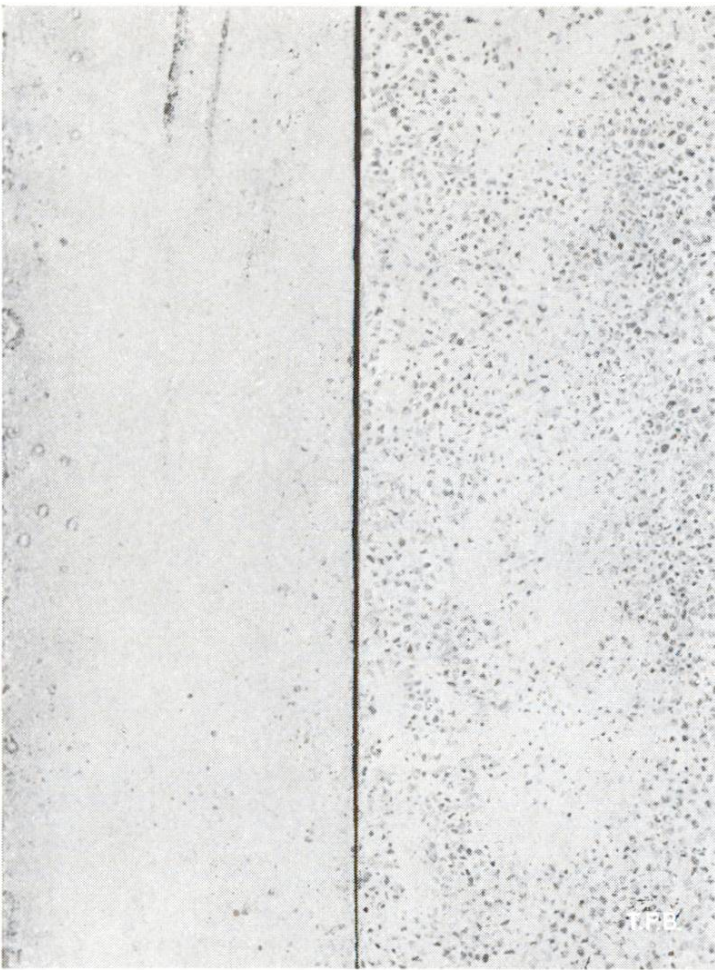
Abb. 4 Beregnungsversuch an Portlandcementmörteln 1 : 3 Links ohne Beregnung. Rechts nach Einwirkung einer Regenmenge, die innert eines Zeitraums von 100 Jahren zu erwarten wäre

auch das in den Kolloiden (gallertartigen) Neubildungen absorbierte Wasser besitzt ganz andere physikalische Eigenschaften als dasjenige, welches als Flüssigkeit, Dampf oder Eis normalerweise in Erscheinung tritt. Insbesondere verdunstet oder gefriert es nicht und macht sich im thermischen Verhalten im Gegensatz zu freiem Wasser (Feuchtigkeit) kaum bemerkbar.