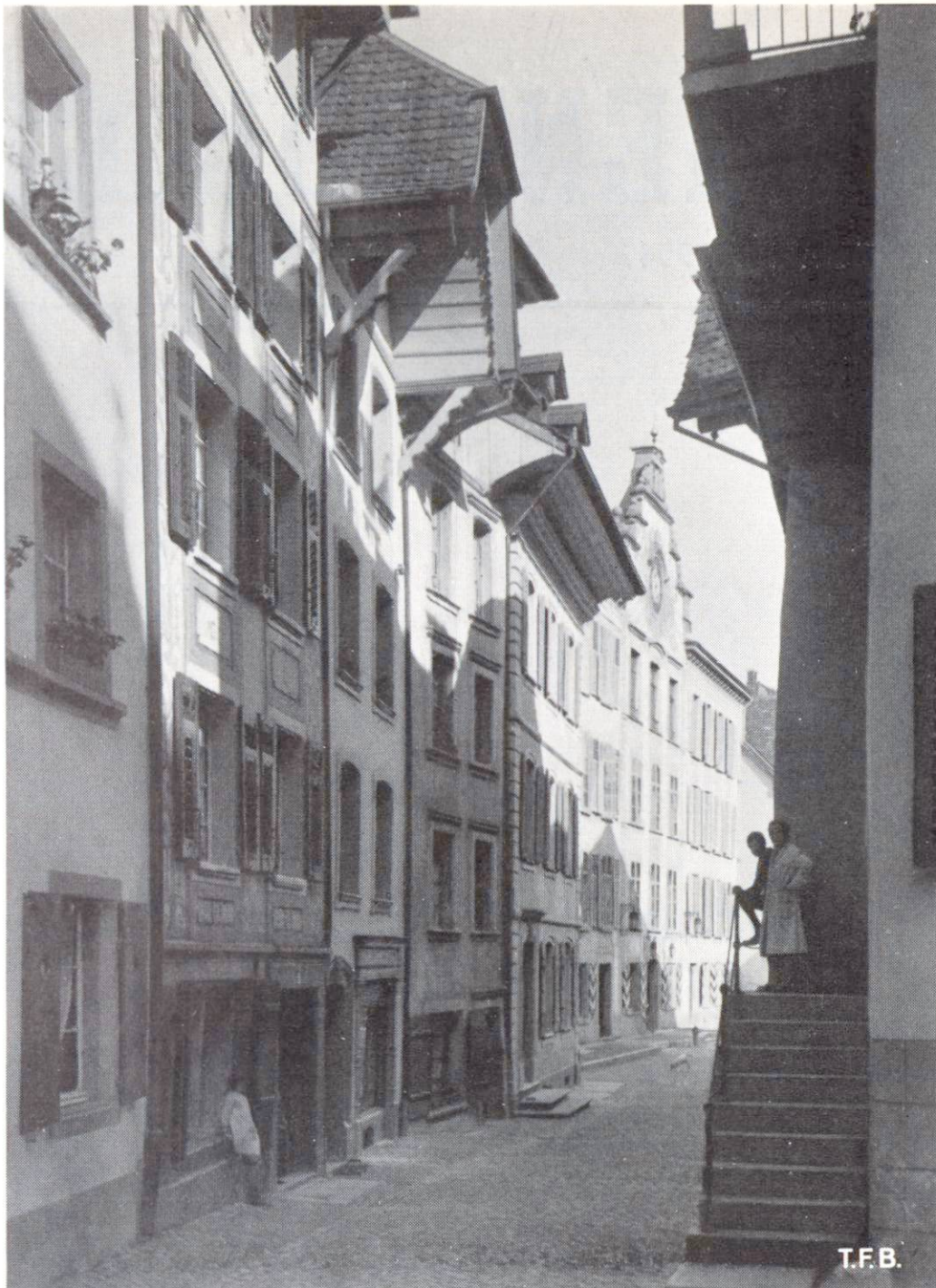
Abb. 2 Die kleinen Gässchen abseits des Durchgangsverkehrs sind am besten erhalten geblieben

Es gibt im Ausland noch einige wenige kleine Städtchen, welche sich, wie durch Zufall, in ihrer Form, ihren Bauwerken und ihrer Grösse seit ausgangs Mittelalter fast rein erhalten haben. Sie liegen abseits der alten Verkehrswege, Handel und Wandel blieb auf die nächste Umgebung beschränkt, die Entwicklung war in einem frühen Zeitpunkt stillgestanden. Vielleicht haben auch die ehemals mächtigen Zünfte, die mehr auf die Erhaltung des Bestehenden als auf die Einführung von Neuem bedacht waren, zum Dornröschenschlaf ihrer Städtchen beigetragen. Heute sind diese merkwürdigen Orte zu weltbekannten Sehenswürdigkeiten geworden. Es darf kaum mehr etwas an ihnen gerührt werden und selbst die Ein-