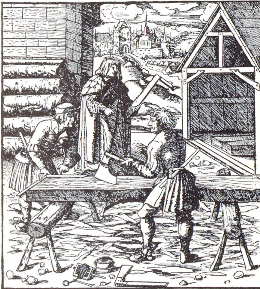
Abb. 4 Zimmerleute bei der Arbeit. Holzschnitt des Hans Schüpflein, 1530