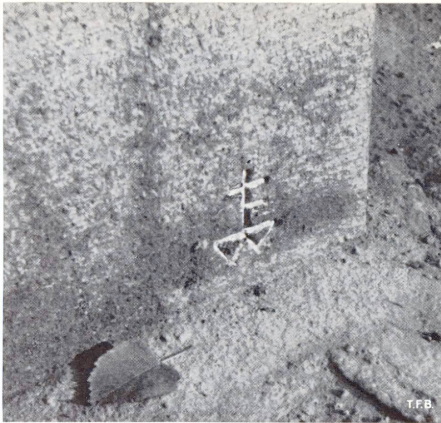
Abb. 3 Steinmetzzeichen des Steinhauers Felix Buchser an einem Brunnenstock 1955