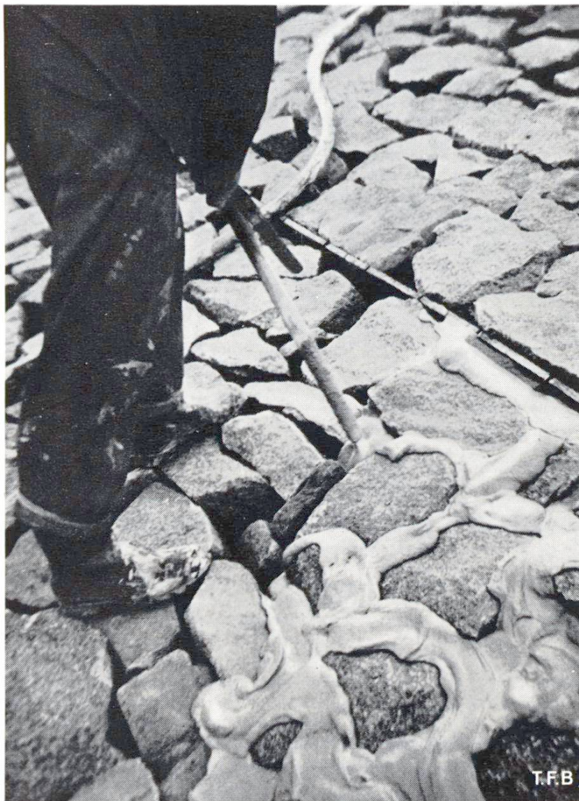
Abb. 2 Herstellen von Colcrete- Ausgussbeton, Damm geschüttet, Oberfläche gesetzt, 20–30 cm tief vermörtelt. Böschungneigung 1:1½ bis 1:2½.

Die oben geschilderte bessere Aufschlussweise des Wasser-Zement-Gemisches und damit die Herstellung eines besonderen Mörtels gegenüber der üblichen Mörtelaufbereitung hat zur Entwicklung eines neueren Betonherstellungs- und Verarbeitungsverfahrens geführt, dem Colcrete -Verfahren.