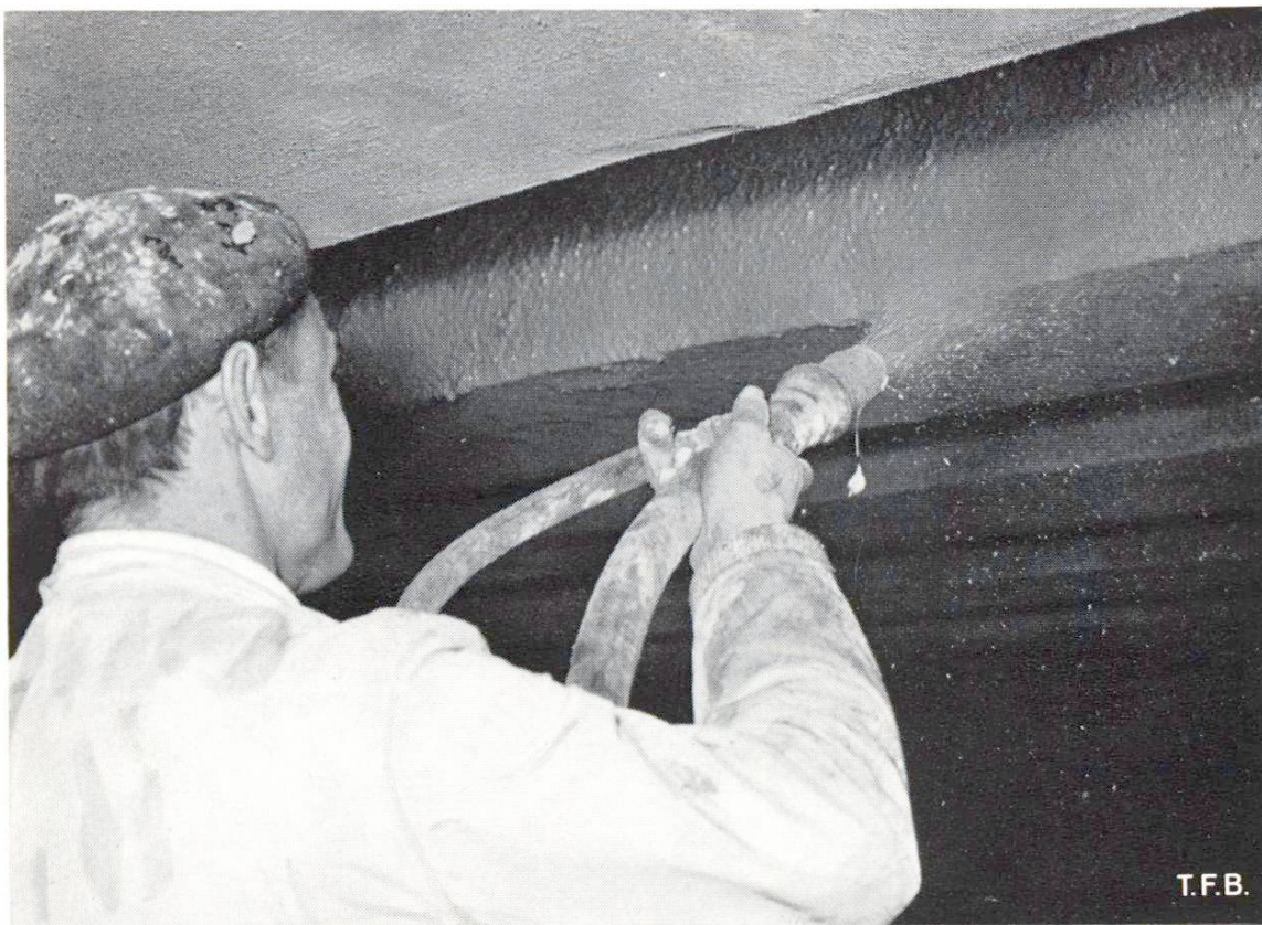
Abb. 4 Gespritzter Colgrout. Lageweises Aufspritzen von Colcrete-Beton mit der Colcrete-Spritzdüse bis zum vollen Querschnitt der Plattenbalken einer Tunneldecke.

Zu jeder weiteren Auskunft steht zur Verfügung die TECHNISCHE FORSCHUNGS- UND BERATUNGSSTELLE DER SCHWEIZERISCHEN ZEMENTINDUSTRIE WILDEGG, Telephon (064) 8 43 71