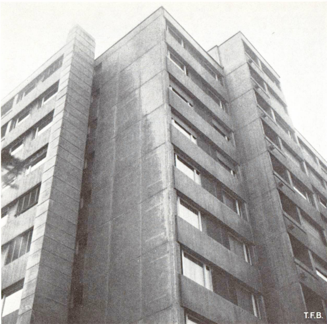
Abb. 2 Fassadenteil mit sichtbarem Einfluss von Schlagregen.

Abb. 3 zeigt eine kleine Abschränkungsmauer, die vor etwa 6 Jahren als Ortsbeton in Bretterschalung erstellt worden ist. Ein Schalungsbrett zeichnet sich ungewöhnlich hell ab, wie auch ein kurzer Abschnitt der Dreieckleiste.