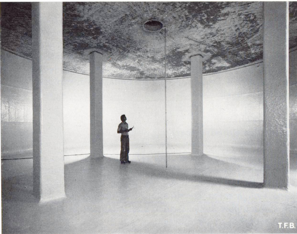
Abb. 3 Grosser Betontank mit Doppelmantel-Auskleidung fertiggestellt.