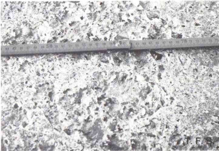
Abb. 2 Absplitterung durch Tausalzeinwirkung auf einer Treppenstufe.