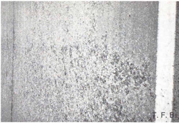
Abb. 1 Tausalzschäden auf einer Betonstrasse.