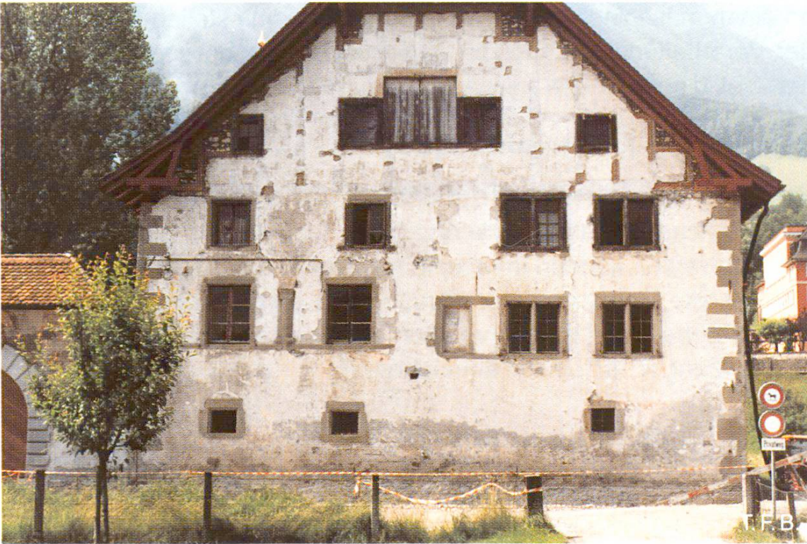
Abb. 2 Deutlich sichtbar ist die vom Fundament her aufsteigende Feuchtigkeit (Winkelriedhaus, Stans, Nordfassade, Juli 1987).

andere Möglichkeit: Nach dem Abbürsten und Abblasen der Mauer werden die fehlenden Steine ersetzt und die Fugen so gestopft, dass der Mörtel satt und rissfrei an die Steinflanken anschliesst. Nach dem Erhärten des Fugenmörtels können die Steinflächen mit dem Hochdruckwasserstrahl nachgereinigt werden.