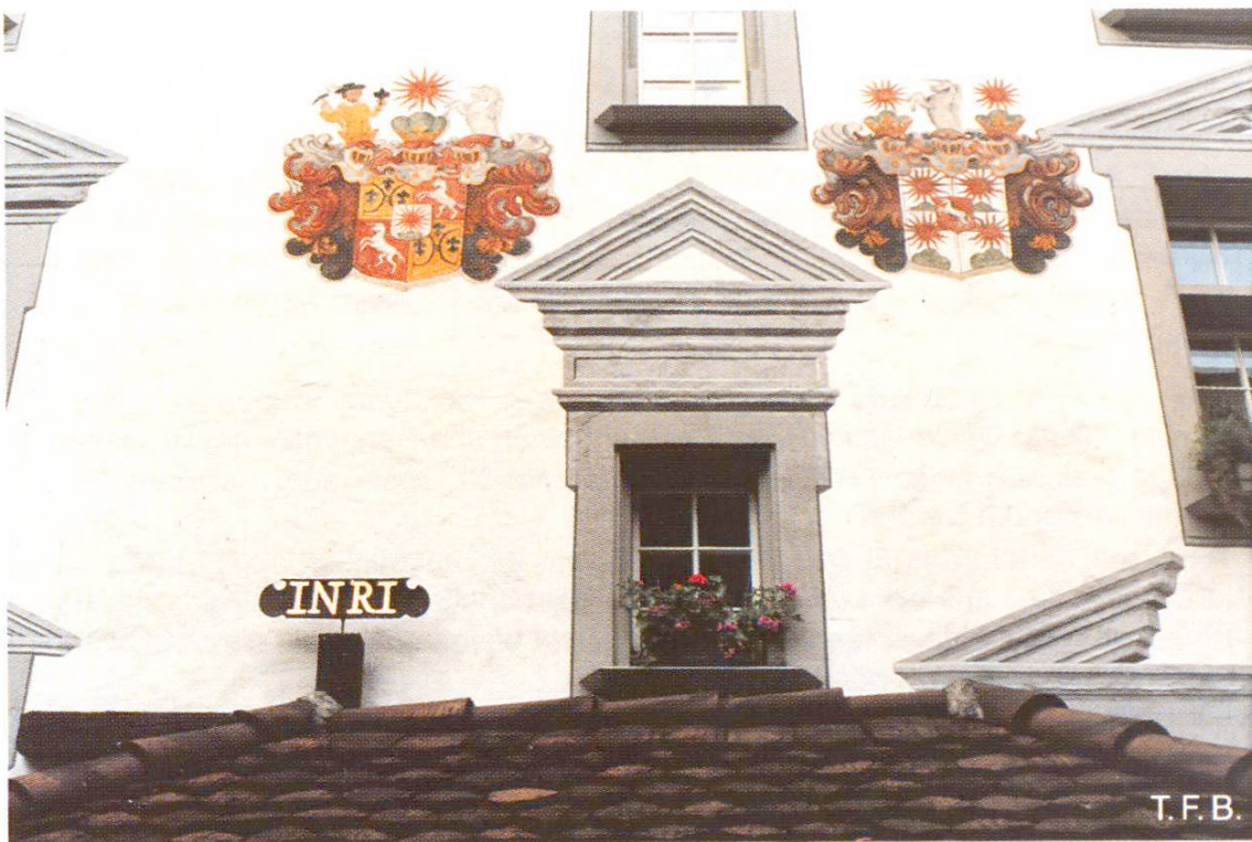
Abb. 4 Vermutlich wurde hier der Grundputz mit der Kelle dressiert bzw. geglättet (Haus zur Liebenau, Luzern).

quadern mit regelmässigen Fugen wurde früher nicht und sollte auch heute nicht verputzt werden. Ein sauberes Ausfugen sichert den Fortbestand einer solchen Mauer (vgl. «Cementbulletin» Nr. 9/86).