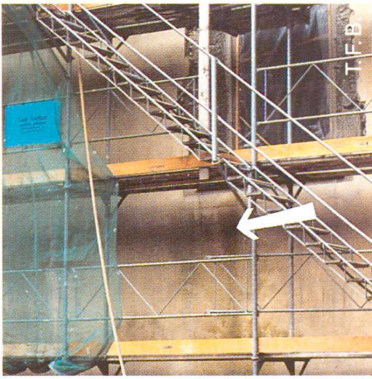
Abb. 3 Wegen einer Dachreparatur wurde diese Fassade stellenweise ständig durchfeuchtet. Folge: Algenbewuchs nach drei Monaten.

Ganz abzuraten ist vom Wässern der Fassade mit dem Schlauch. Staub und lösliche Stoffe würden «oben» zwar entfernt, doch «unten» vom Mauerwerk aus dem herablaufenden Wasser begierig wieder aufgenommen, nicht zu reden von der grossen Wahrscheinlichkeit, jene unteren Partien zu «ersäufen».