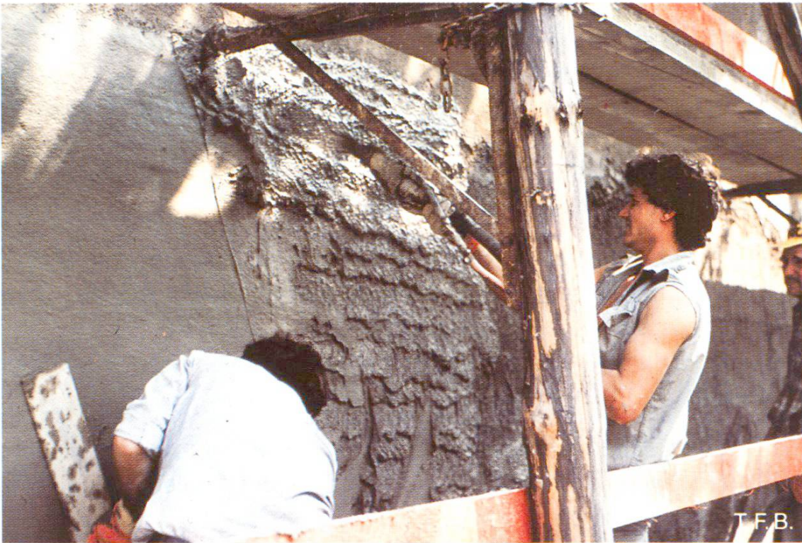
Abb. 6 Renovation einer Fassade mit konventionellem HK-Grundputz (Sand 0–4 mm). Mörtel gepumpt und mit Spritzdüse aufgetragen. Durch Verziehen mit Latte entsteht eine Sinterhaut, die entfernt werden muss.

Maurer für den Handauftrag innert nützlicher Frist fehlen. Der Vollständigkeit halber sei erwähnt, dass auch konventionell hergestellter Mörtel gepumpt und mit der Spritzdüse aufgetragen werden kann (Abb. 6). Im Idealfall spritzt der Düsenführer den Mörtel gut verteilt und in der richtigen Menge auf, so dass der Grundputz nach dreimaligem Verziehen mit der h-Latte steht, d. h.