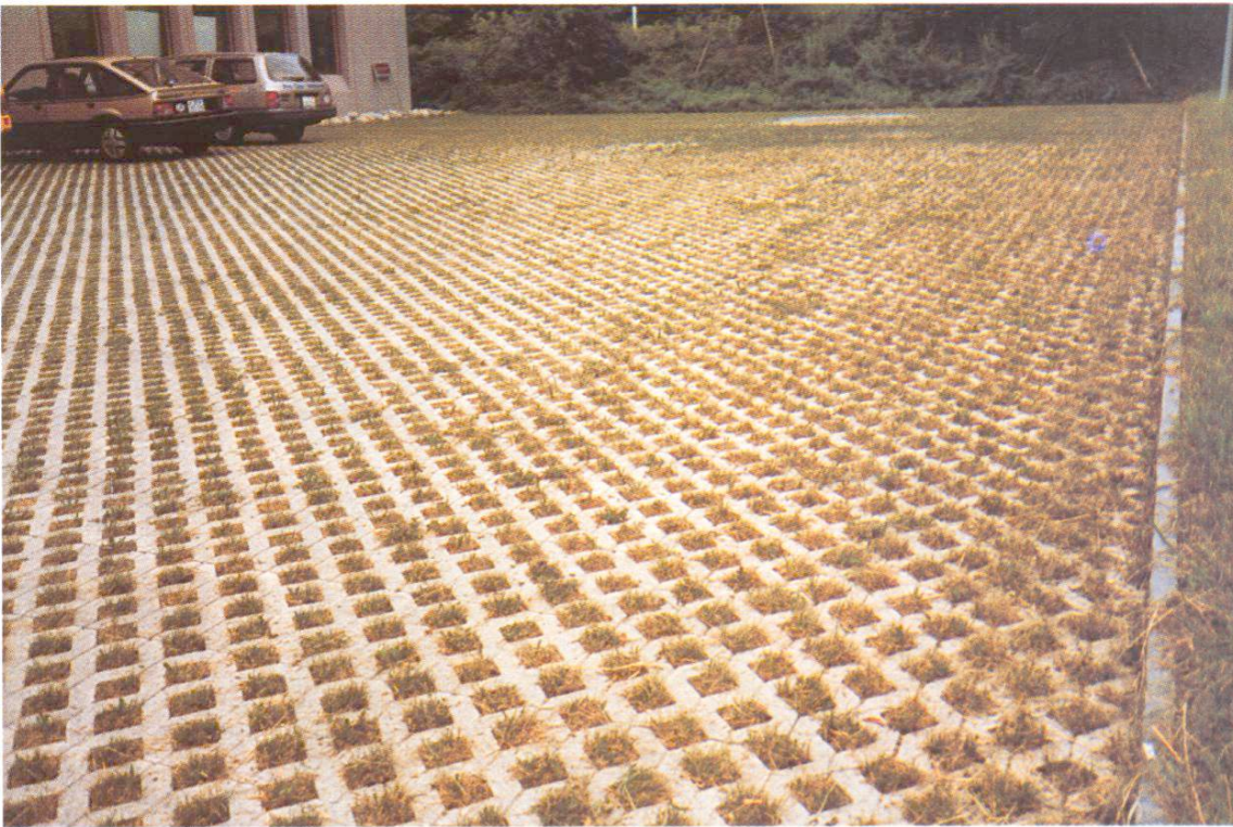
Abb. 5 Parkplatz, nicht durchgehend belegt.

den. Sie haben den Vorteil guter Begehbarkeit und Farbwirkung, schränken aber den Planer in den Abmessungen ein, weil sie eine gröbere Feldaufteilung bestimmen. Ausserdem erschweren sie den Ablauf des Verlegens. Deshalb werden Füllsteine für die Kammern der Rasengittersteine angeboten, was eine feinere Einteilung ermöglicht (Abb. 2, 3).