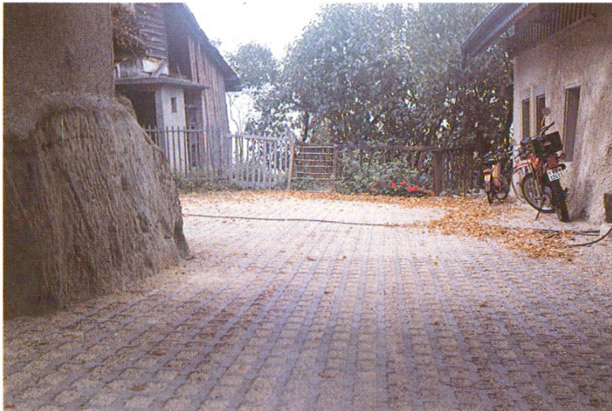
Abb. 9 Innenhof.