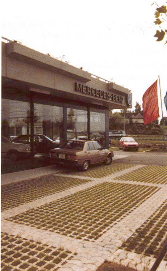
Abb. 2 Markierung der Parkflächen mit Pflastersteinen.