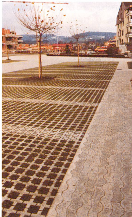
Abb. 3 Markierung der Parkflächen mit Füllsteinen.