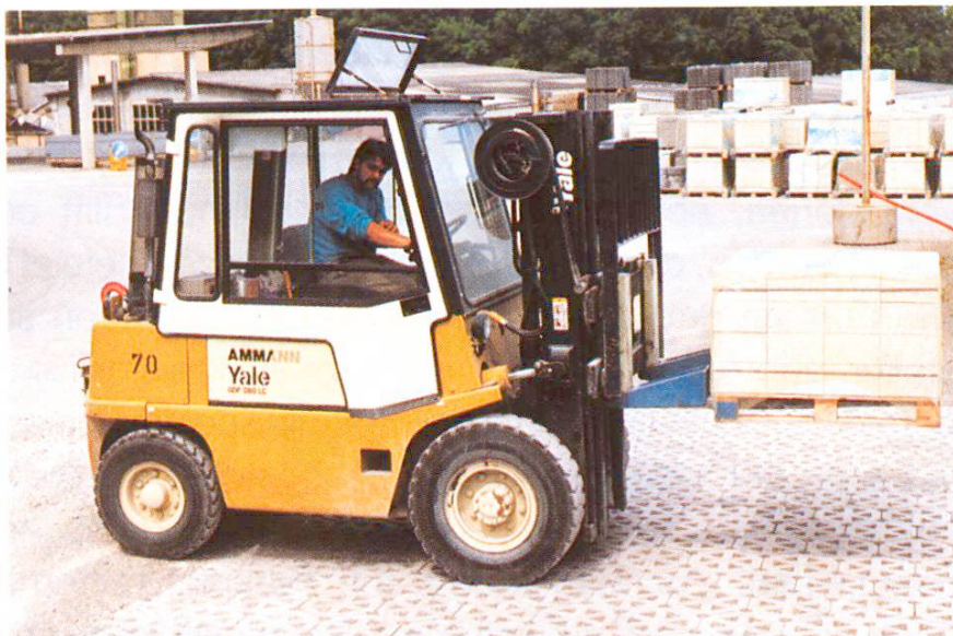
Abb. 10 Spezieller Gitterstein für Lagerplatz.