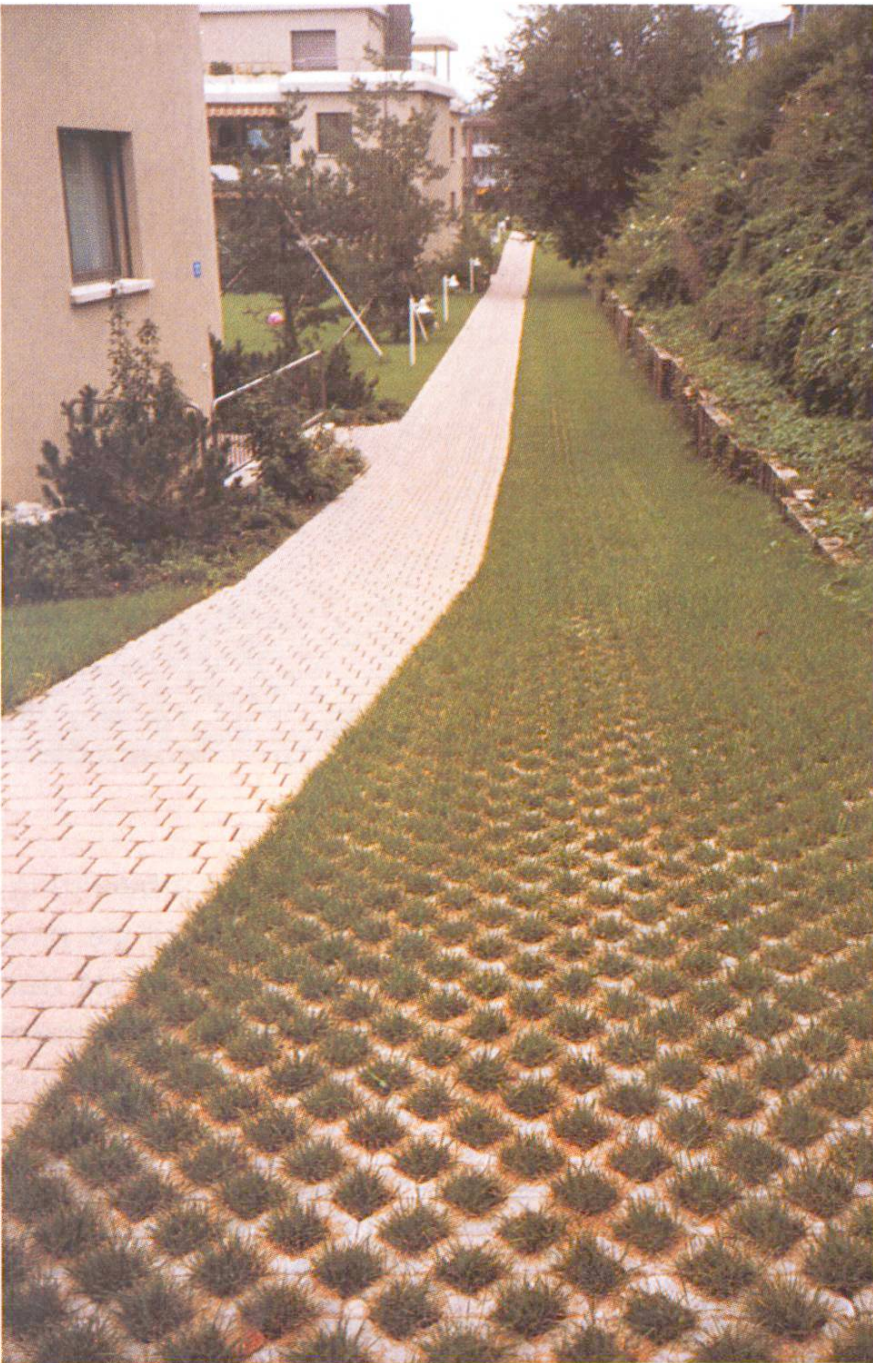
Abb. 6 Gehweg in Pflasterstein, Notzufahrt mit Rasengitterstein (rechts).