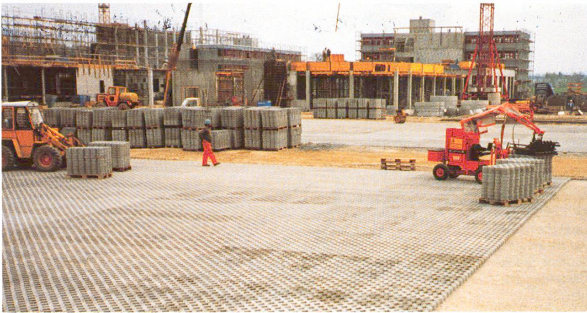
Abb. 4 Verlegen der Rasengittersteine: bei grösseren Flächen maschinell.

versehen. Sie ist massgebend für die Tragfähigkeit und die Dauerhaftigkeit des Platzes. Nur bei gutem Untergrund kann darauf verzichtet werden. Die Deckschicht besteht aus Verlegehilfe und Rasengitterstein. Für die Verlegehilfe wird am besten Splitt 3–6 mm oder gewaschener Sand verwendet. Bei ungewaschenem Sand besteht die Gefahr, dass diese Schicht mit der Zeit dicht wird. Die Rasengittersteine sind in den Stärken 8, 10 oder 12 cm erhältlich (für hohe Belastung gibt es noch stärkere Steine). Sie sind meist rechteckförmig und werden beim Verlegen stumpf gestossen. Spezialformen können eine Verbundwirkung erzielen. Ihre Oberflächen sind glatt oder gewellt. Die Kammern werden mit einem Sand-Humus-Gemisch knapp aufgefüllt, das sich noch leicht setzen wird, so dass der Verkehr auf den Betonrippen rollt. Für die Bepflanzung bestehen Samenmischungen [3, 5]. Zeitpunkt der Aussaat ist die Vegetationsperiode. Eine Schonzeit bis zum ersten Schnitt ist beim Rasengitterstein nicht erforderlich. Gegenüber dem Schotterrasen haben die Rasengittersteine den Nachteil, dass sich keine durchgehende Vegetationsschicht bilden kann. Ist aber gar keine Bepflanzung vorgesehen, so sollen die Kammern mit Splitt oder Sickerbeton gefüllt werden, damit die Versickerung gewährleistet bleibt.