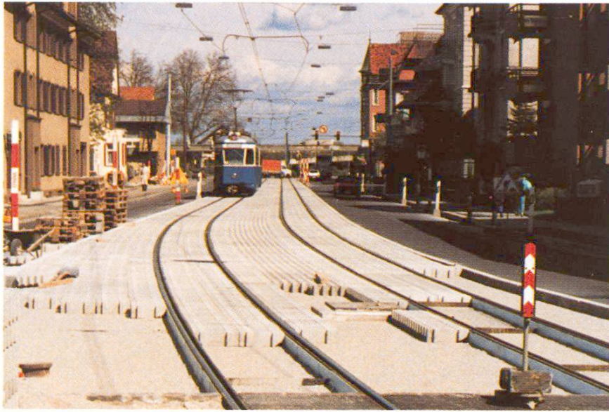
Abb. 8 Trasse für Strassenbahn, nach Beendigung der Bauarbeiten begrünt. Starke Dämpfung des Lärms.