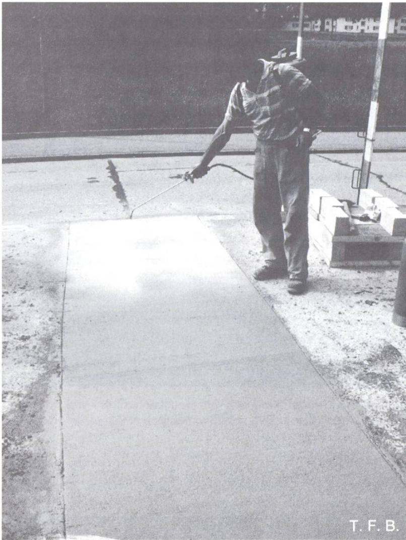
Abb. 5 Reparatur eines Betonbelags. Aufbringen von Curing Compound als Nachbehandlung. Beginn etwa 5–15 Minuten nach der Oberflächenbehandlung (d. h. sobald die Oberfläche matt ist). An-schliessend Abb. 6