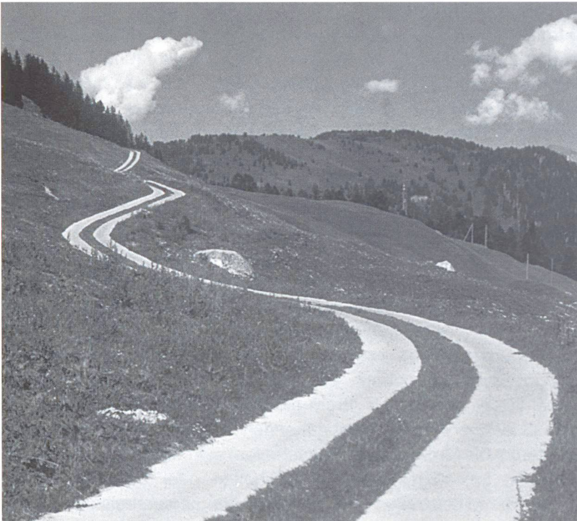
Betonspurwege gliedern sich harmonisch in die Landschaft ein, wie dieses Beispiel oberhalb Zillis im Kanton Graubünden zeigt.

Der Ablauf des Betonierens ist genau festzulegen. Bei der Verwendung von Fertigbeton müssen geeignete Zufahrten vorhanden sein, die einen kontinuierlichen Antransport von Beton gewährleisten, damit die jeweiligen Tagesetappen ohne Unterbruch erstellt werden können. Festzulegen sind zudem die verwendeten Transport- und Einbaugeräte. (Bei einer Steigung von über 12 % kann ein Fahrmi-scher nicht mehr entleert werden!) Gleitschalungsfertiger benötigen zudem neben den Betonspuren jeweils einen rund 50 cm breiten Streifen.