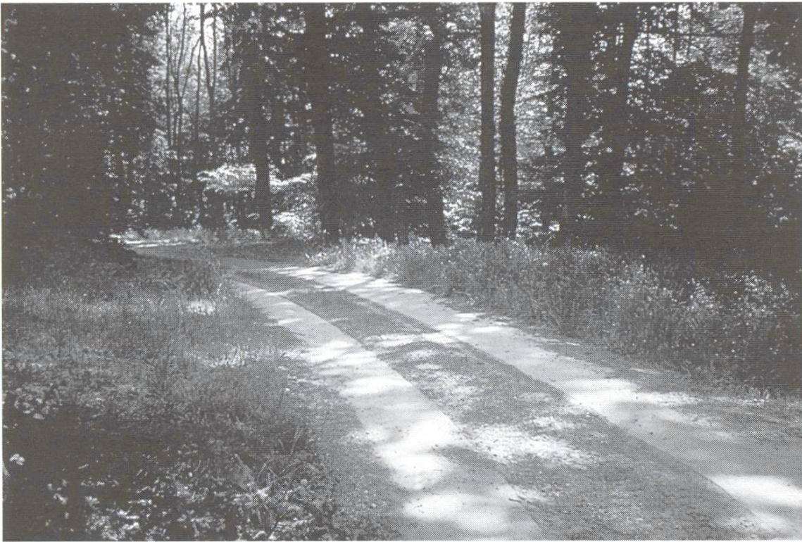
Auch die Bewirtschaftung von Wäldern wird durch Spurwege erleichtert.

Beton B 35/25, der 325 \text{ kg PC/m}^3 enthält. Schwalbenschwanz- oder verdübelte Bogenverbindungen verhindern, dass sich die einzelnen Elemente vertikal verschieben. Für den Koffer kann altes Wegmaterial eingesetzt werden. Als Planie dient eine etwa 3 cm dicke Schicht aus Brechsand 0–8 mm.