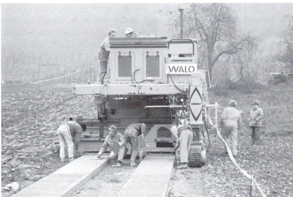
Moderne Gleitschalungsfertiger erleichtern den Bau von Betonspurwegen.

Wie immer beim Strassenbau gilt auch hier, dass die Lebensdauer eines Weges entscheidend von der Wirksamkeit der Entwässerung abhängt. Als Lösungen bieten sich eine geringe Querneigung der Spuren (2,5–4 %) oder leicht bombierte Einzelspuren an.