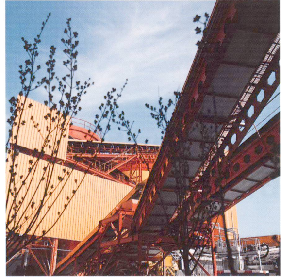
Anlieferung von Zuschlagstoffen.