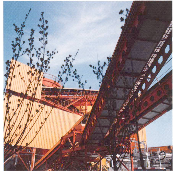
Anlieferung von Zuschlagstoffen.