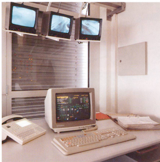
Produktionssteuerung über PC.