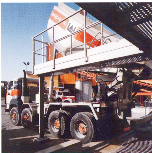
Reinigung von Muldenkipper.

Die Transportbetonwerke sind in der Lage, auch im Sommer Beton mit dem richtigen Vorhaltemass zu liefern.