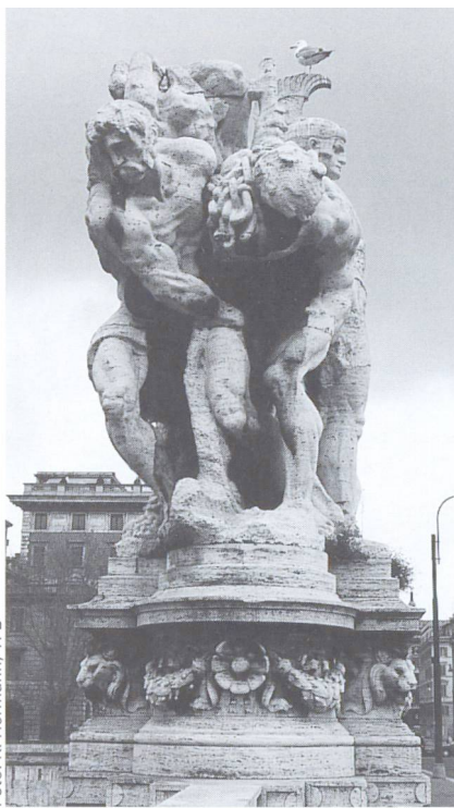
Der saure Regen hinterlässt Spuren, auch auf Statuen.

Auswirkungen geblieben. Dies lässt sich anhand der Veränderung der Immissionen (Schadstoffkonzentrationen oder Schadstoffdepositionen am Einwirkungsort) der typischen Luftschadstoffe Schwefeldioxid, Stickstoffdioxid und Ozon ( O_3 ) zeigen.