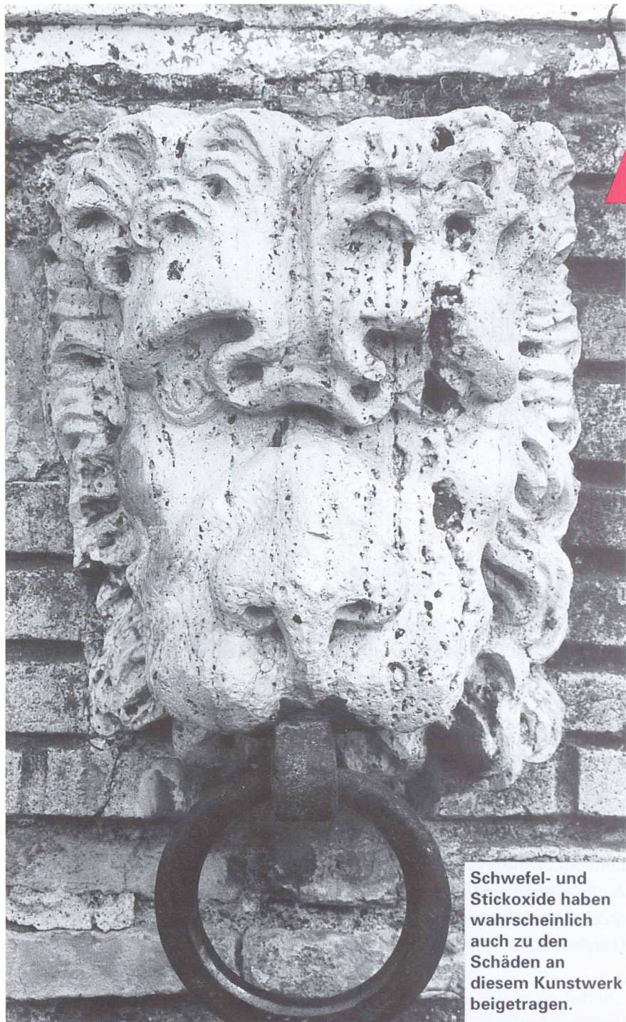
Schwefel- und Stickoxide haben wahrscheinlich auch zu den Schäden an diesem Kunstwerk beigetragen.