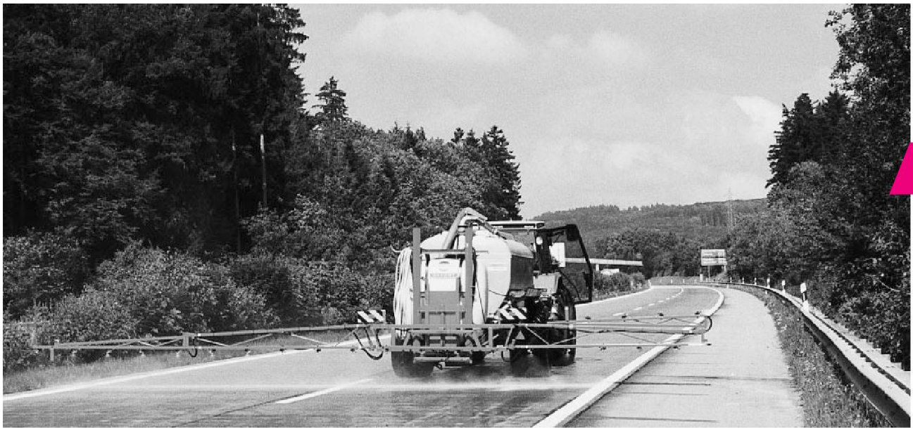
Hydrophobierung einer Betonfahrbahn.