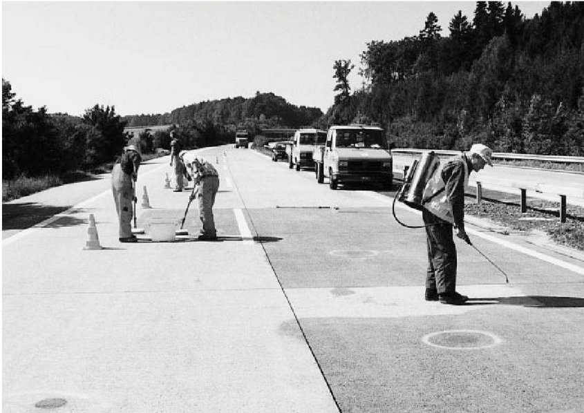
Vorversuche für die Hydrophobierung einer Betonfahrbahn: Auftragen des Imprägnierungsmittels durch Spritzen bzw. Rollen.