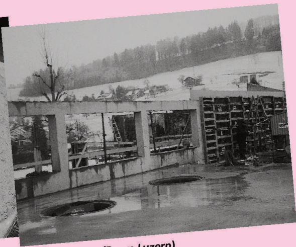
SCC-Sichtbeton (Raum Luzern)