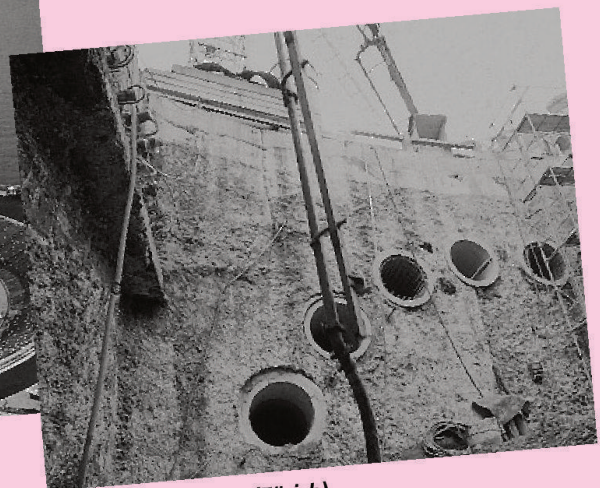
Rohrschirm aus SCC (Zürich)