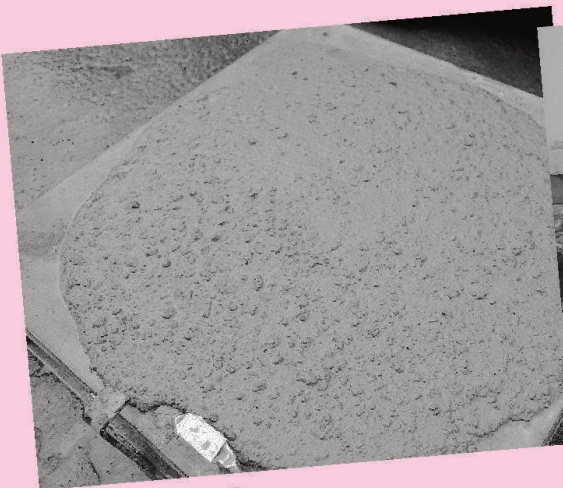
Konsistenz von SCC