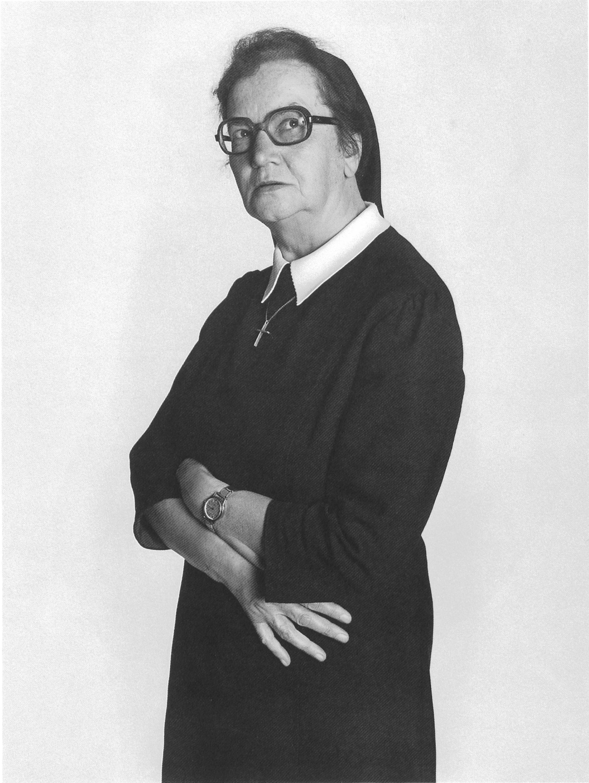
Primarlehrerin Maîtresse d'école