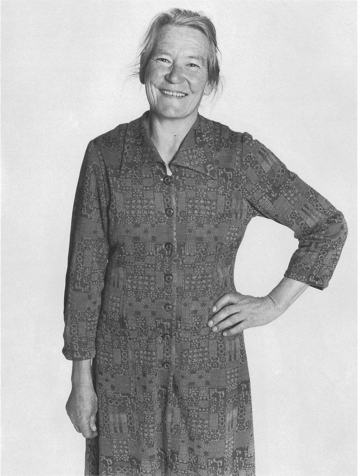
Bergbäuerin Paysanne de la montagne