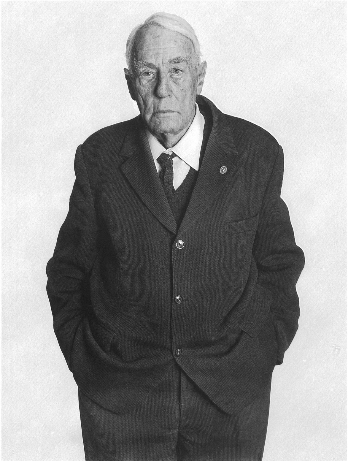
Forstingenieur Ingénieur forestier