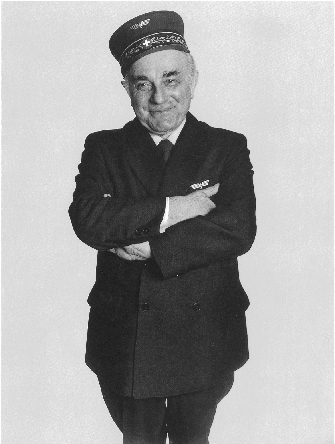
Bahnhofsvorstand Chef de gare