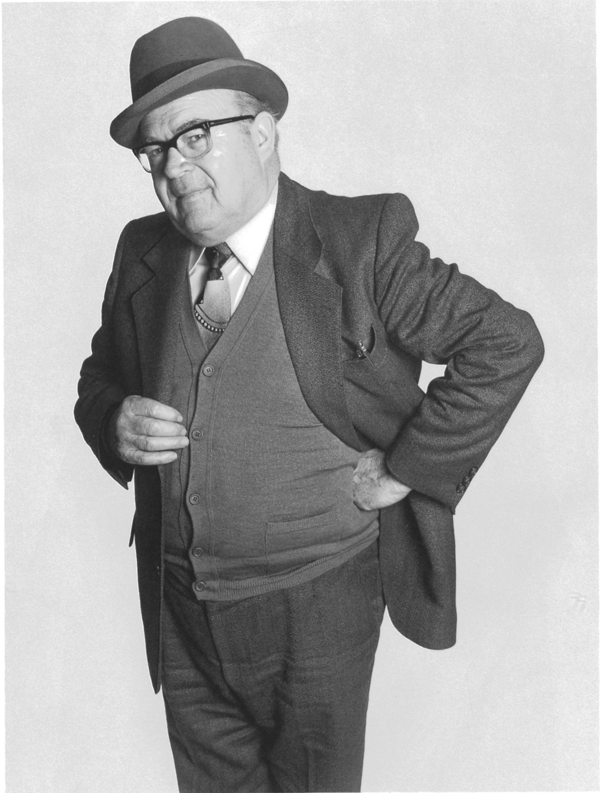
Bauunternehmer Entrepreneur de construction