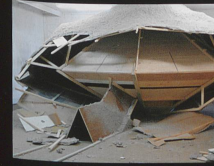
Destruction créatrice Installation, 2008 Wartesaal, Perla-Mode, Zürich