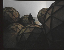
Un rien négatif Installation, 2006 Salle Crosnier, Genève