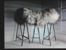
Cellules dormantes n°3 Objet, 2008 Galerie In Situ, Paris