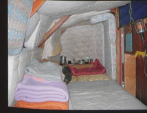
Il y a que l'inaccessible qui vaille la peine , Installation, 2005 Villa Bemasconi, Genève