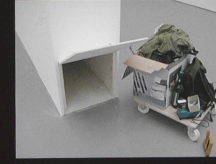
Intra muros n°3 Installation, 2008 Kunsthau Zürich