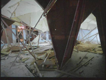
No Place Like Home Installation, 2007 Stadt Galerie, Bern