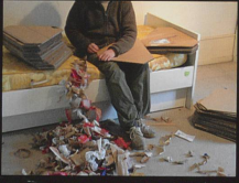
Atelier n°79 Lambda Print, 2006 Genève