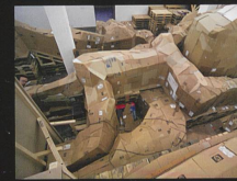
Hyperspace Installation, 2005 Kunsthalle St. Gallen