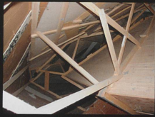
Destruction créatrice Installation, 2008 Wartesaal, Perla-Mode, Zürich