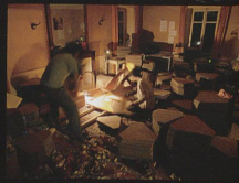
Atelier n°79 Lambda Print, 2006 Genève