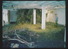
Nature morte Installation, 2003 Espace A-Zéro, Genève