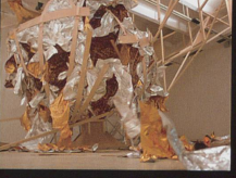
Métamorphose d'impact Installation, 2007 Le Crédac & Attitudes, Paris