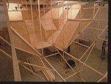
Métamorphose d'impact Installation, 2007 Le Crédac & Attitudes, Paris