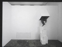
Hyperspace Installation, 2005 Kunsthalle St. Gallen