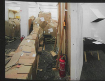
Hyperspace Installation, 2005 Kunsthalle St. Gallen