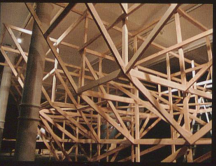
Untitled Yet Installation, 2008 Swiss Institute, New York