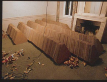
Atelier n°79 Lambda Print, 2006 Genève