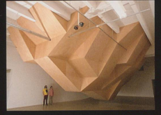
Métamorphose d'impact Installation, 2007 Le Crédac & Attitudes, Paris