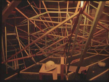
Cryptomnesia Installation, 2007 Le Printemps de Septembre, Toulouse