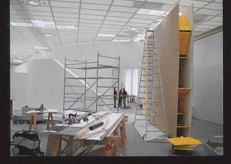
Intra muros n°3 Installation, 2008 Kunsthau Zürich