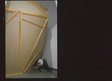
Cryptomnesia Installation, 2007 Le Printemps de Septembre, Toulouse