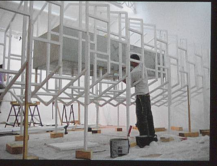
Trembling Hand Perfect Equilibrium Installation, 2008 Galerie In Situ, Paris