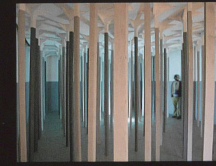
C'en dessus dessous Installation, 2008 La Box, Bourges