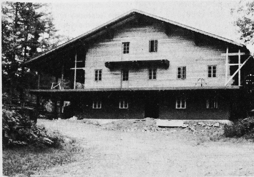
Club House of the Swiss Canadian Mountain Range Association Vancouver.