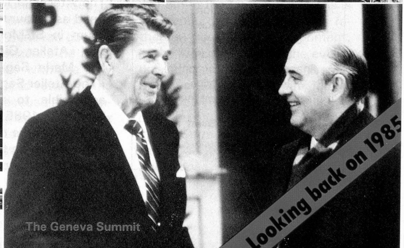
The Geneva Summit