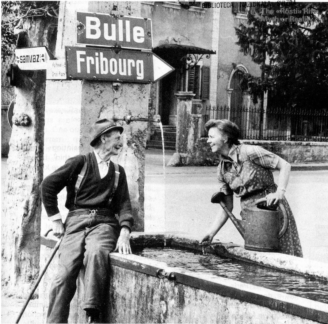
The «Rösti» Rite Myth or Reality?