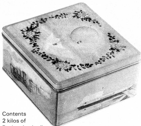
Contents 2 kilos of Basler «Leckerli»

We are looking forward to sending you quite soon sweet greetings from Basle.