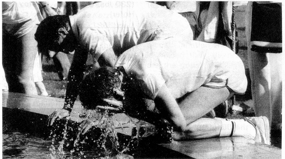
Cooling down at the finish