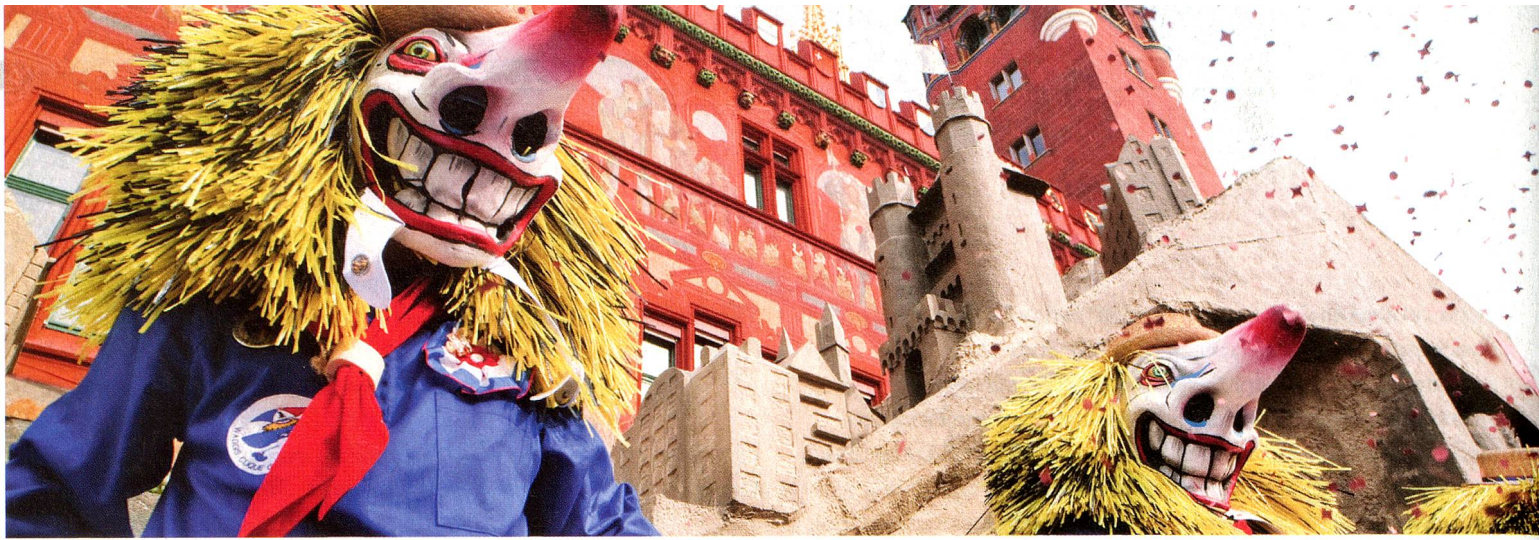
Carnival in Basel, Basel Region