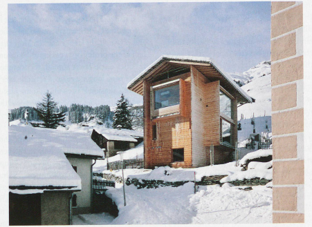
A house built by the architect Peter Zumthor in Leis photographed by Ralph Feiner in 2012