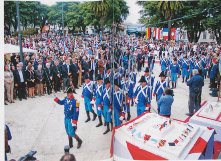
150 years of Nueva Helvecia in Uruguay was celebrated with military parades in 2012. Around 1,000 Swiss abroad currently live in this South American country