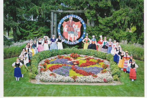
Many traditions have continued for generations in New Glarus, founded in 1845

SWISS REVIEW June 2013 No. 3