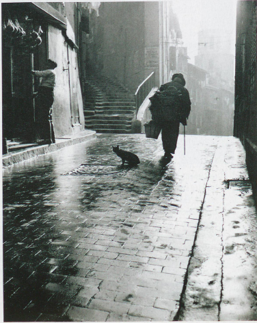
An alleyway in Marseille in the early morning

staged at two museums, uses individual stories and biographies to show what emigration is all about and how emigrants to all parts of the world attempt to integrate a bit of their old homeland into their new one. "Appenzeller Auswanderung - Von Not und Freiheit" exhibition at the Volkskunde-Museum in Stein and at the Brauchtummuseum in Urnäsch. Duration: until 27 October in Stein, until 13 January 2014 in Urnäsch. www.appenzeller-museum-stein.ch www.museum-urnaesch.ch .