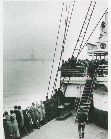
Emigrants aboard a ship approaching New York, taken in 1915 by Edwin Levick