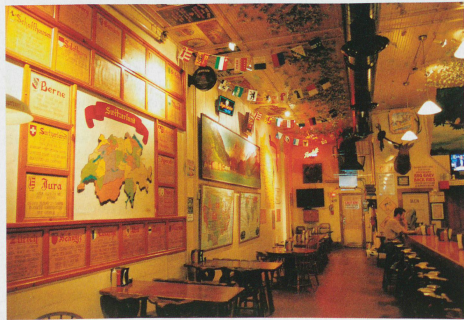
"The Original Baumgartner", the Swiss tavern with cheese shop has existed in Wisconsin since 1931