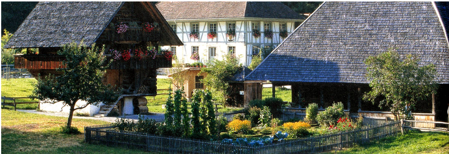
Ballenberg, the open-air museum of rural culture, Bernese Oberland