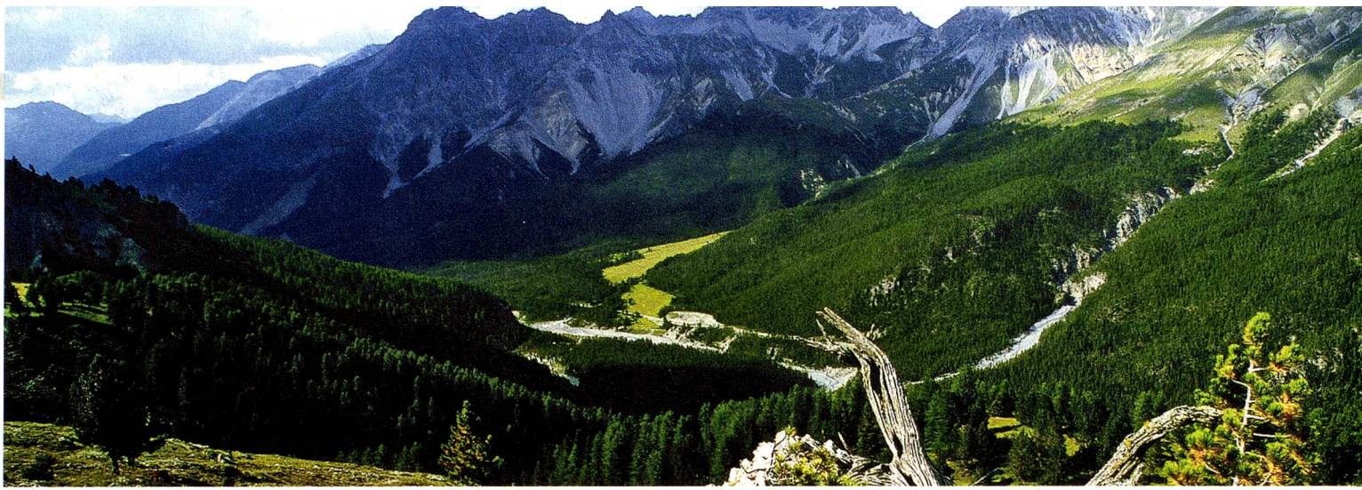
Swiss National Park, Graubünden