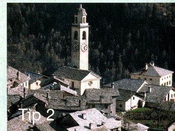
MySwitzerland.com Webcode: A147088

Val Bregaglia, south of Graubünden, is a paradise for hikers and climbers, but it is also a source of continuing inspiration for numerous artists. This idyllic valley is where the famous Alberto Giacometti spent his early years.