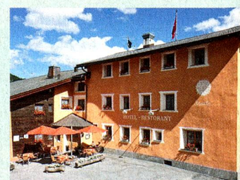
MySwitzerland.com Webcode: A54633

Register by 30 September 2013 at www.MySwitzerland.com/aso and win a 2-night stay for 2 persons at the Typically Swiss Hotel Landgasthof Staila*** in Fuldera for a memorable stay in Val Müstair.