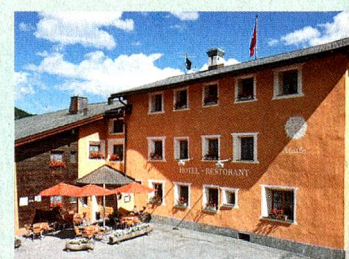
MySwitzerland.com Webcode: A54633

Register by 30 September 2013 at www.MySwitzerland.com/aso and win a 2-night stay for 2 persons at the Typically Swiss Hotel Landgasthof Staila*** in Fuldera for a memorable stay in Val Müstair.