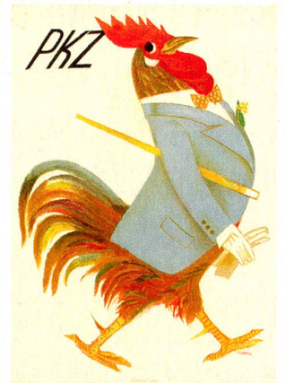
Poster for PKZ (1935)