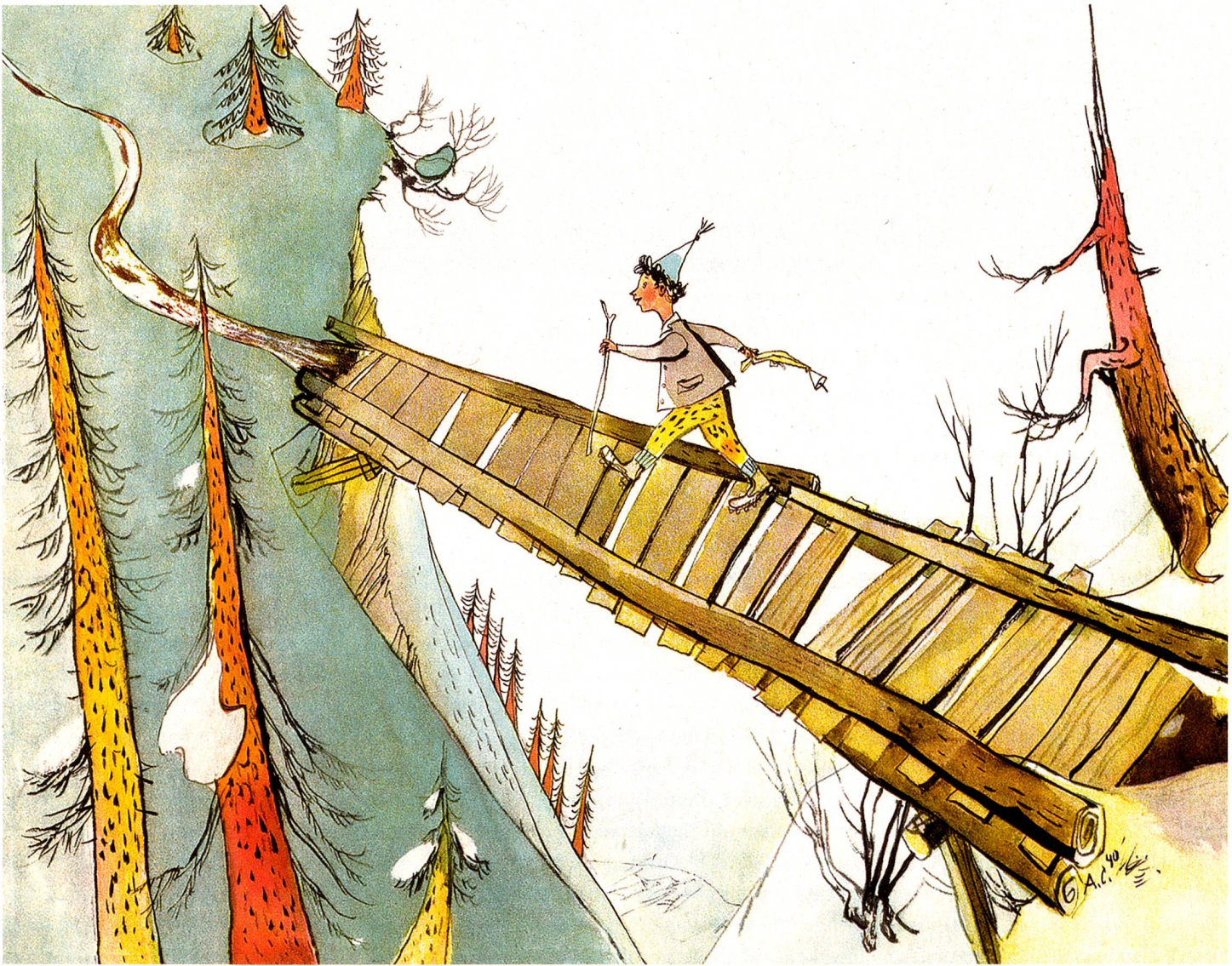
Schellen-Ursli on the way to the alpine hut