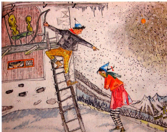
From the book “Flurina and the Wild Bird”