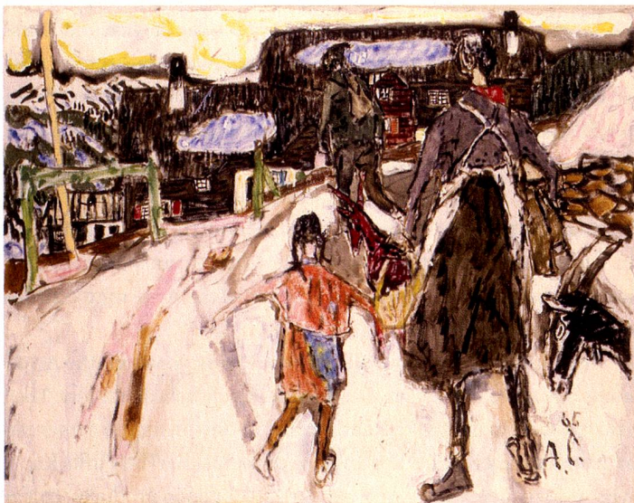
Die Bergbauernfamilie (1965), oil on canvas

Now to mark the 30th anniversary of the death of Alois Carigiet (1902 – 1985) and the 70th birthday of “Schellenursli”, the Swiss National Museum in Zurich is paying tribute to the work of Carigiet. The title of the exhibition “Alois Carigiet. Art, Graphic Art & Schellen-Ursli” underlines that the painter from Grisons deserves just as much acclaim for his work as a graphic artist, set designer and painter as for his illustrated books. In tandem with the exhibition a book entitled “Alois