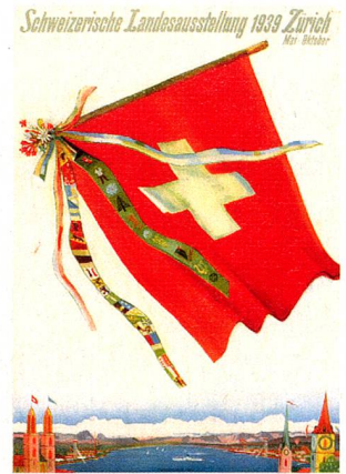
Poster for 1939 national exhibition in Zurich