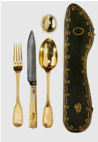
Elegant silverware from around 1790, found in the kitchens of the upper echelons of society.