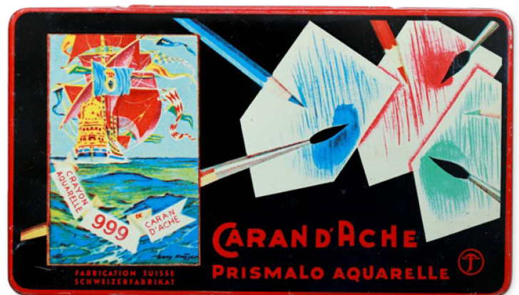
Caran d’Ache developed the Prismo watercolour colouring pencil in the 1930s. The cases containing multicoloured rows of pencils were popular among generations of Swiss children. (RB)