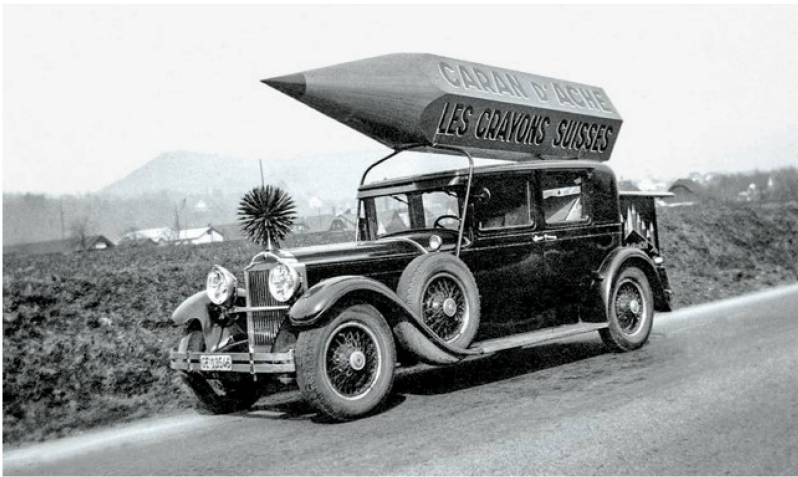
Pencil rocket – Caran d’Ache went on an advertising offensive at the end of 1920s.