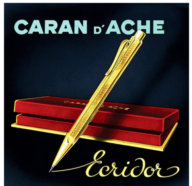
The Ecrivor – millions of these luxurious hexagonal pens were sold from 1953.