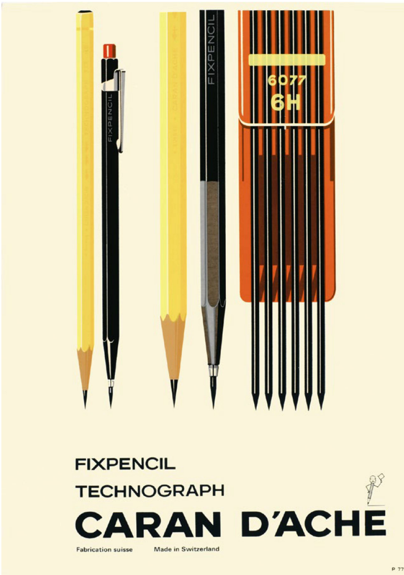
Caran d’Ache patented the Fixpencil in 1930. This new form of mechanical pencil was particularly popular among technical illustrators. (CdA company archive)