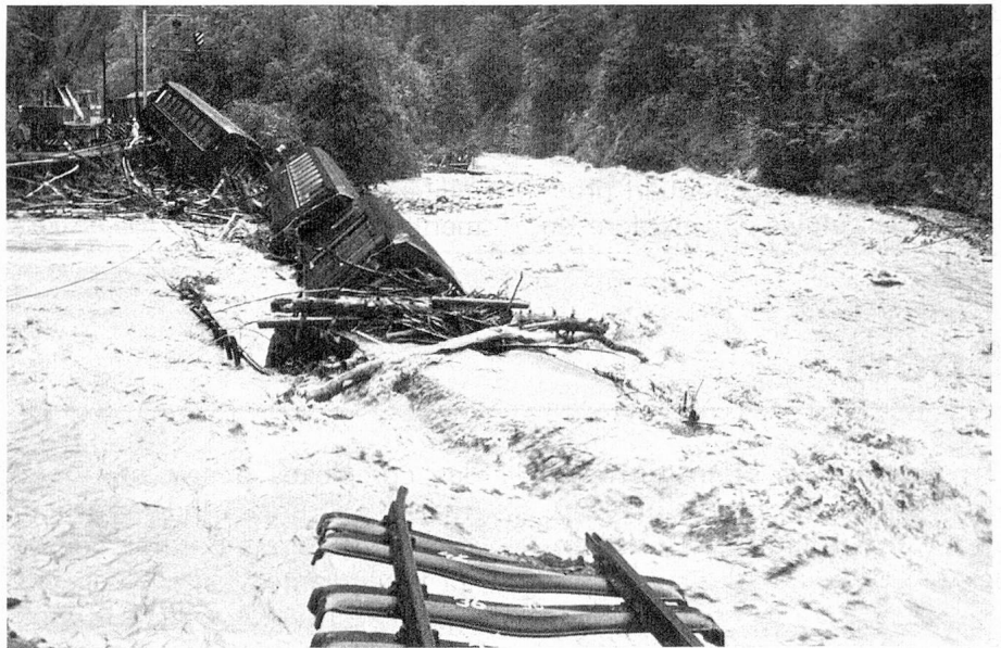
Accident ferroviaire près de Davos (Keystone).

Le comité d'initiative de Berthoud dépose à Berne son initiative pour