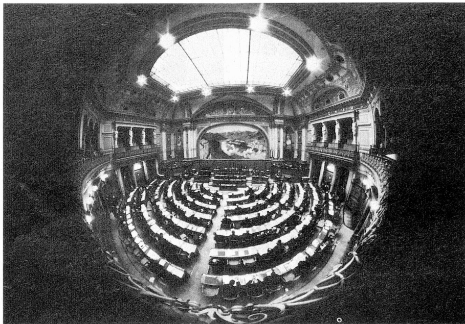
Le Conseil national

● 2 radicaux , le Zurichois Ernst Brugger (entré en 1969) et le Vaudois Georges-André Chevallaz (entré en 1973).