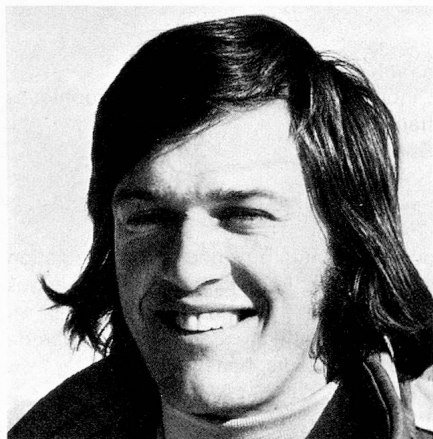
◀ Bernhard Russi, une deuxième place méritée dans la descente à ski.