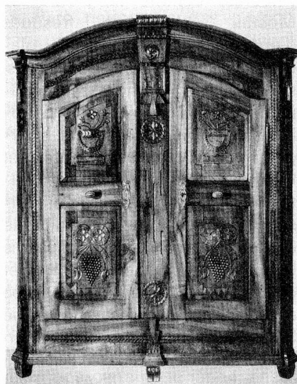
Armoire, 1830, Suisse orientale

saient jadis des bois exotiques pour obtenir des coloris contrastés de même valeur.