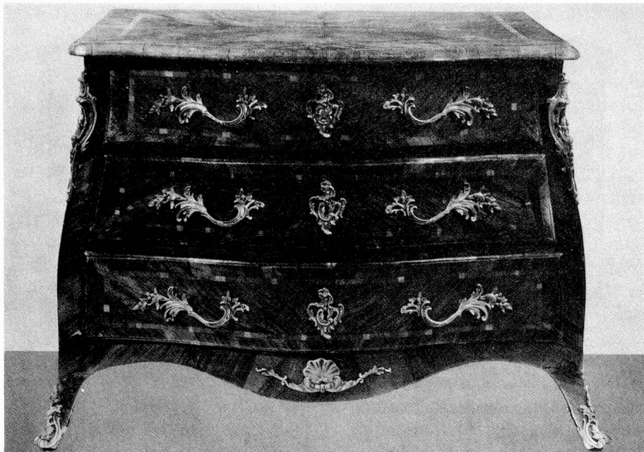
Commode Louis XV, Berne