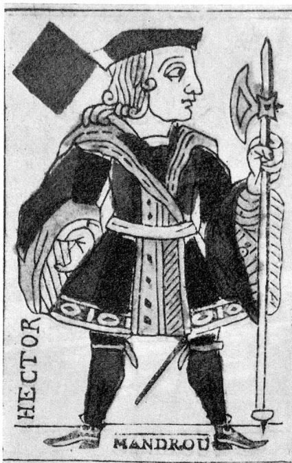
Carte à jouer de J.-J. Rousseau, tirée de la Revue neuchâteloise n° 51

Le jass est vraiment un jeu national dont les règles subissent de nombreuses interprétations locales. Naguère, les cafés affichaient un règlement anonyme parfois approuvé par une société cantonale de cafetiers, dans un endroit mal éclairé, difficilement accessible. Les jasseurs qui ont lu ces règlements sont une infime minorité, d'où cette floraison d'interprétations locales. Il existe de nombreuses conventions qui servent d'ententes entre partenaires, non enregistrées dans un règlement, quoique parfaitement correctes.