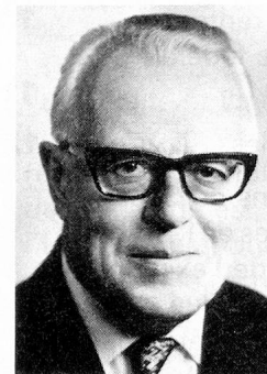
Pierre Graber Département politique fédéral