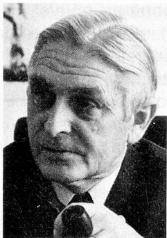
Ernst Brugger Département fédéral de l'économie publique