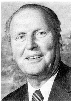
Willy Ritschard Vice-président Département fédéral des transports, des communications et de l'énergie