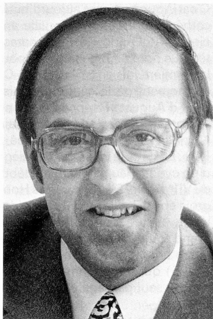
Kurt Furgler Président de la Confédération Département fédéral de justice et police