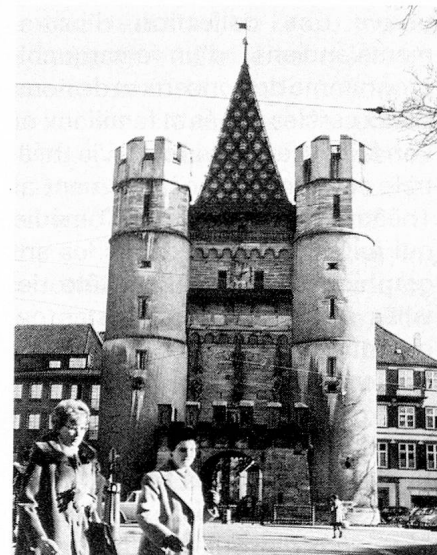
Le Spalentor, à Bâle, la plus grande et la plus belle tour de l'ancienne enceinte de la ville, construite avant 1398.

L'université est toujours l'orgueil de l'antique cité du négoce. Pour elle, et surtout au début du XIX e siècle, les bourgeois ont souvent fait des sacrifices considérables, conscients de leurs responsabilités envers l'héritage humaniste, et reconnaissant aussi la nécessité pratique d'un meilleur équipement intellectuel. Il est significatif que la communauté de travail dans le domaine de la recherche soit devenue toujours plus étroite entre