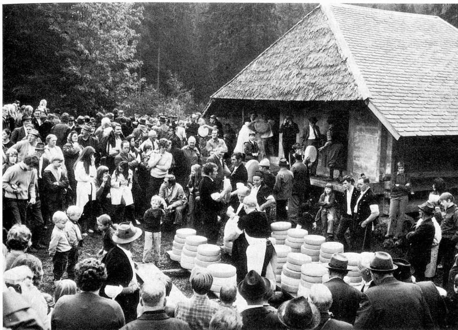
Partage des fromages dans le Justistal