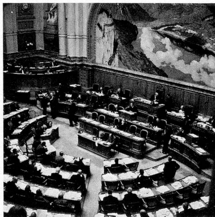
Assemblée du Conseil national

Deux pour mille, voilà ce que représentent les Suisses sur l'ensemble de la population de la planète. C'est peu, évidemment. Mais il n'empêche – malgré l'exiguïté du pays – que les Suisses vivent dans un monde aux mul-