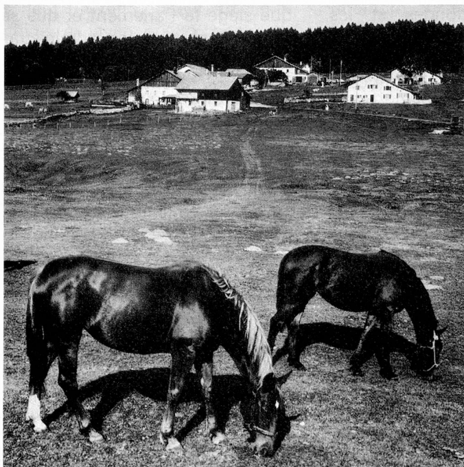
Les Franches-Montagnes près de Cerneux-Veulil