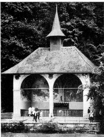
La chapelle de Tell

Politiquement, chaque Suisse peut s'engager comme bon lui semble. La neutralité n'est que la marque de la politique extérieure de l'Etat. Le pays n'intervient dans