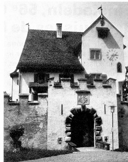
Le petit château de A Pro, à Seedorf

Une attraction très connue à Altdorf est la représentation de l'histoire de Guillaume Tell de Schiller qui a lieu chaque année à la maison des fêtes, alors qu'un récent atelier-théâtre à Altdorf se consacre avec beaucoup de réussite à des œuvres plus modestes. Un groupe culturel s'est penché sur les traditions anciennes et remet à l'honneur la poésie, les contes, fait de la recherche historique, de la philosophie ainsi que met en évidence les us et coutumes de la région qui sont très