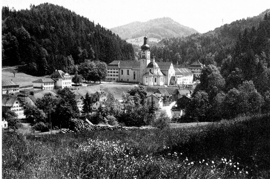
Abbaye des Bénédictins et église baroque à Fischingen

disséminées dans la vallée de la Thur, il convient de citer des meuneries importantes, des fabriques de carton et de machines sans omettre de signaler une entreprise de dimensions internationales vouant son activité aux produits oléagineux. Dans l'arrière-pays du sud, aujourd'hui fortement industrialisé, l'on trouve des fabriques de textiles, de meubles, de l'industrie métallurgique (parasols, stores, aménagements de cuisine) ainsi que de l'industrie chimique. En bref, une palette haute en couleurs.