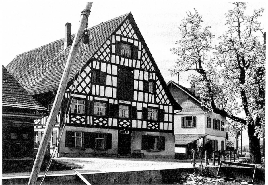
Maison à colombage à Ermatingen

Dans cette région on retrouve des vestiges de civilisation humaine datant de 2800 avant J.-C. A l'âge de la pierre on trouve des villages près du lac d'Egel, non loin de Niederwil et Breitenloo à l'ouest de Pfylen, dont la culture était semblable. Durant le néolithique on s'adonnait à la culture et à l'élevage, ce qui attira bon nombre d'émigrants en diverses vagues importantes. Ainsi vers 1800 avant J.-C. les potiers, puis les marchands d'objets en bronze firent leur apparition en provenance du sud, les Celtes par le nord. Puis durant 400 ans, la région fit partie de l'empire romain sans avoir à en souffrir, bien au contraire, car ils apportèrent leur connaissance, leur architecture, tout en développant la culture fruitière et la vigne. C'est durant cette période qu'un réseau routier fut mis en place pour des besoins commerciaux et militaires qui permit de relier les places de Arbor Felix (Arbon), Ad fines (Pfylen) et Tasgetium (Eschenz) au réseau du plateau suisse. Les Romains établirent plusieurs villes-garnison. L'invasion des Alamans fut brutale, ils imposèrent au pays leur langue, leurs us et coutumes ainsi que leur architecture. La caste des francs, connue sous le nom de Gau prit place sur près d'un quart de la Suisse actuelle et c'est à cette époque que l'on entendit parler pour la première fois de Thur-Gau dont on retrouve des traces dans une franchise saint-galloise de 744. Devenu un duché dans la répartition géographique qui suivit, il s'ins-